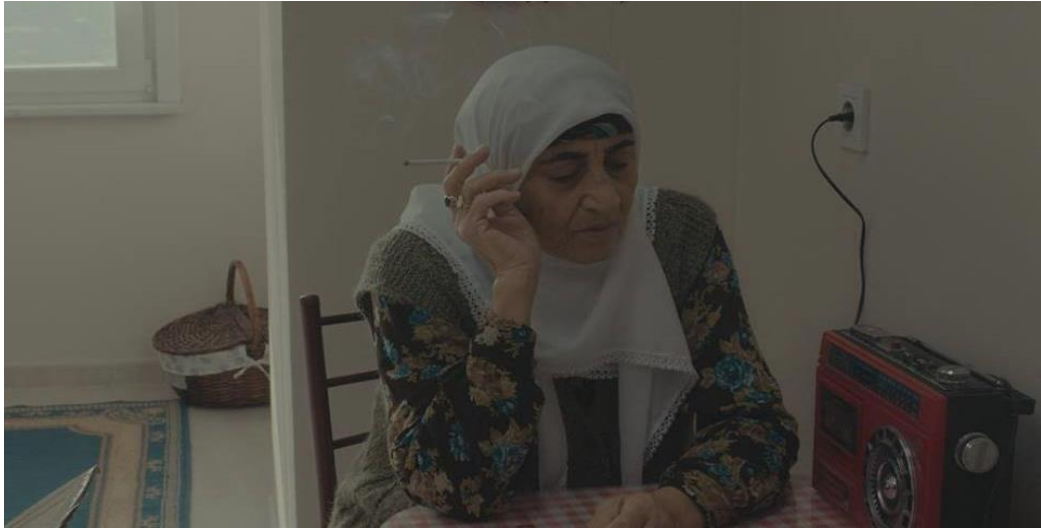
Şekil 3 Annemin Şarkısı Filminden Sahneler