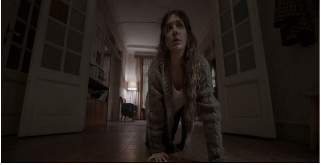
Şekil 9 Kaygı Filminden Sahneler

çağrışimleri duyumsamaktadır. Ancak ne olduğunu anımsamaların çıkarımını tam olarak yapamamakta ve bilmediği bu durum onu, fazlasıyla rahatsız etmektedir. Bu bölüm, artık psikolojik gerilimin filmde fazlasıyla hissedilmeye başlandığı bölümdür.