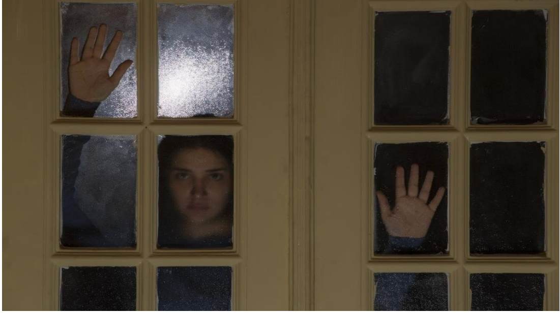
Şekil 10 Kaygı Filminden Sahneler