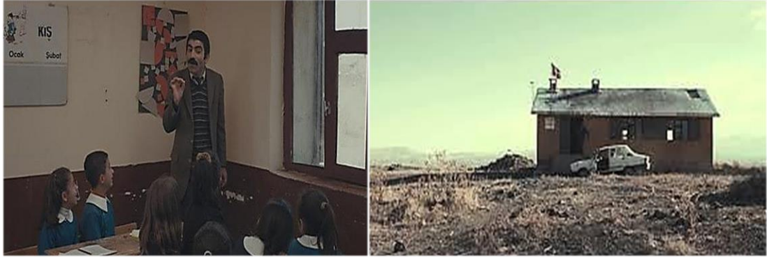
Şekil 1 Annemin Şarkısı Filminden Sahneler

Film, 1992 yılında Doğubeyazıt'ın bir köy okulunda başlar. Sınıfta öğretmen, öğrencilerine Kürtçe, Karga ile Tavus Kuşu hikâyesini anlatmaktadır. Öğretmenin hikâyeyi anlatırken hikâyeye uyumlu olarak kullandığı jest ve mimikler, öğrenciler tarafından keyifle izlenmektedir. “Karga sabah erken kalkıp gölün kenarına gider. Birden kara bir şey görür suda. Karakuru bir şey ak ak parlayan bir çift göz. O sırada kafasını şöyle bir kaldırır ve gölün diğer tarafından geçmekte olan tavus kuşlarını görür. Onlara seslenir: ‘Tavuslar! Tavuslar! Ben neden sizin gibi böyle güzel değilim de çirkinim? Havalı tavus kuşları iyice kabarıyor. Onu hiç umursamazlar. Karga, tavus kuşlarının peşine takılır. Havalı havalı yürüyen kuşlardan dökülen rengârenk tüyleri toplayıp, kendisine yapıştırır. Sonra göle gidip kendisine bakar. O artık bir tavus kuşudur. Onlar gibi havalı yürümeye başlar. Bazen çaktırmadan kuşların arasına karışıp onlarla zaman geçirir. Günlerden bir gün tavus kuşları aralarında şakalaşırken çirkin bir ses fark ederler. Çirkin bir gülme sesi onların sesine karışmaktadır.”