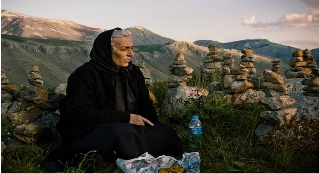
Şekil 4 Babamın Sesi Filminden Sahneler

Basê'nin köyde bir başka uğrak yeri, geniş bir tepe üzerinde bulunan ziyaretgâhtır. Burada Basê, Hasan'ın bir gün dönmesini ritüeller eşliğinde dilemektedir.