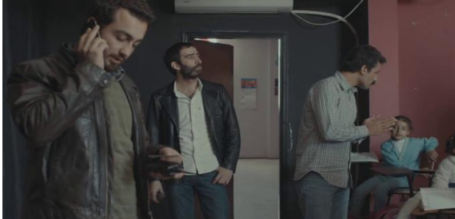
Şekil 2 Annemin Şarkısı Filminden Sahneler