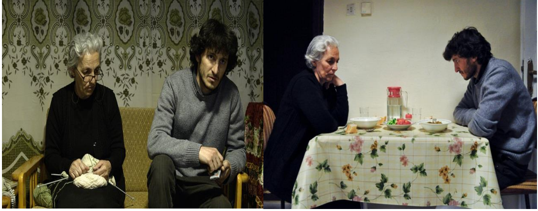
Şekil 5 Babamın Sesi Filminden Sahneler