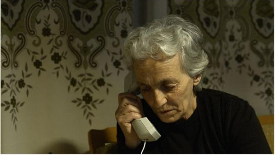
Şekil 6 Babamın Sesi Filminden Sahneler