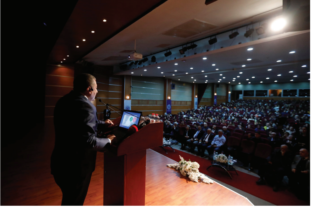
Dr. Mustafa ÇALIŞKAN

İstanbul'un, ülkemizin ve hatta dünyanın problemlerinden birisi de yabancı uyruklu şahısların karıştığı suçlar. İstanbul'da ağırlıklı olarak yaralama, yankesicilik, kişiye yönelik hırsızlık, gasp gibi, hırsızlık gibi olanlarda yabancıların yer aldığını görüyoruz. Bu tablo çok çarpıcı arkadaşlar. Yabancıların işlediği, İstanbul'daki işlenen bütün suçlar, bütün suçlar demeyelim de bizim katalog suçları olarak kabul ettiğimiz, önemli suç olarak kabul ettiğimiz öldürme, yaralama, gasp, oto hırsızlığı, yankesicilik, dolandırıcılık gibi suçların %5.4'ünü yabancılar işlemektedir. Daha çarpıcı olsun diye söyleyeceğim, 300 cinayetin %15'ini, yani 44'ünü yabancılar işlemiştir. Yankesicilik olaylarının %30'unu yabancılar işlemiş. Bunu şöyle değerlendirmeyin yalnız; Sadece Suriyeliler üzerinden değerlendirmeyin. Suriyelilerde suç işleme oranı daha düşük. Başka yabancılarımız da var bizim. Başka yabancılarımız, suça meyilli. Belli suçları işleyen, birini verelim mesela, hırsızlık, gasp, soygun olaylarında Gürcistan'dan gelip burada bu işi yapan insanlar var ve yakalanıyorlar. Buna benzer belli konularda, belli ülkenin insanları daha fazla suç işliyor, bunları da ciddi şekilde takip ediyoruz. Kriminal olarak da böyle bir sorunumuz var.