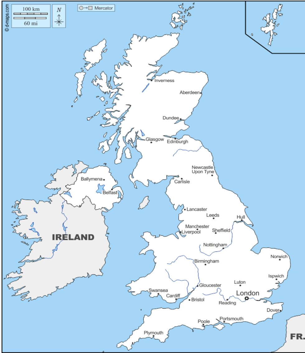
Şekil 1. Büyük Britanya ve Kuzey İrlanda'yı Kapsar Harita

İkinci önemli husus 1921 yılına gelindiğinde dönemin Birleşik Krallık Başbakanı Lloyd George'un İrlandalılar ile demokratik görüşme adımları atması ve günümüz İrlanda Devleti olarak anılacak adanın güney tarafındaki İrlanda'nın resmiyetteki bağımsızlığını bir sene sonra elde etmek üzere geçici bağımsızlığının ilan edilmesidir (Soy, 2014:16). Üçüncü ve son kırılma noktası ise 1968-1998 yılları arasında gerçekleşecek "The Troubles" olarak bilinen olayların fitilini ateşleyen Katolik azınlık protestoları ve Britanya Hükümeti'nin doğrudan yönetime geçtiğinin ilan edilmesidir (Aktoprak, 2015: 329-349). Tüm bu gelişmeler doğrultusunda yıllar boyu sürecek Katolik-Protestan çatışmalarının temeli atılmıştır.