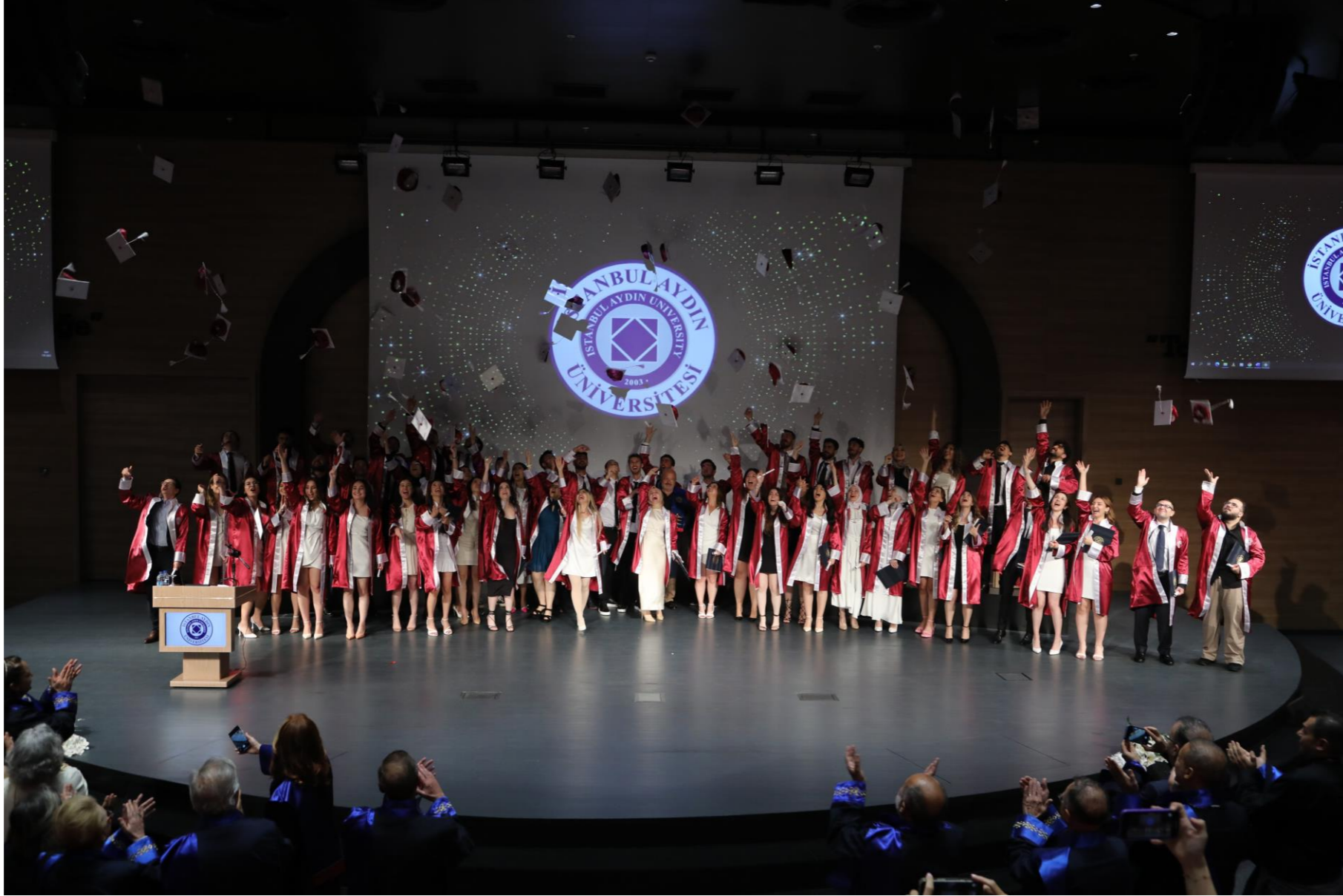
İstanbul Aydın Üniversitesi Tıp Fakültesi (Türkçe Programı) 2023 mezunlarının Yemin Töreni T Blok Kırmızı Salonda gerçekleştirildi.