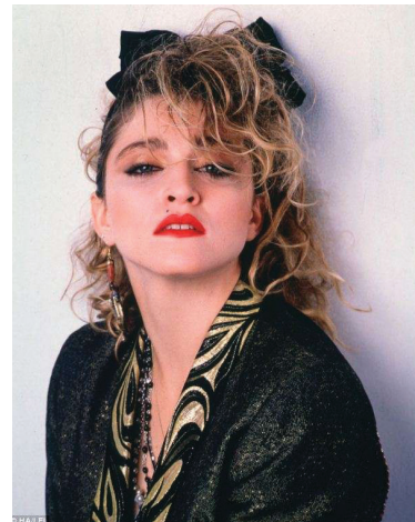
Resim 3: Madonna