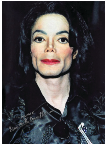
Resim 2: Michael Jackson