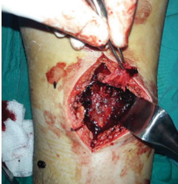
Resim 2. TT avulsiyon kırığı