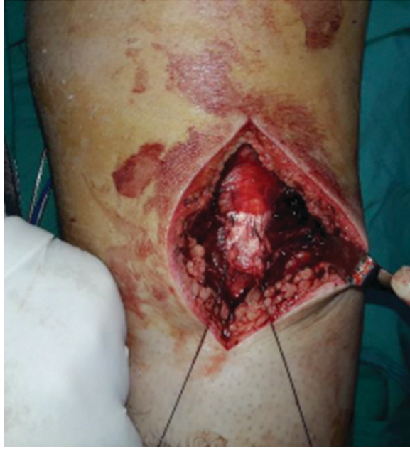
Resim 5. Patellar tendonun sütüre edilmesi