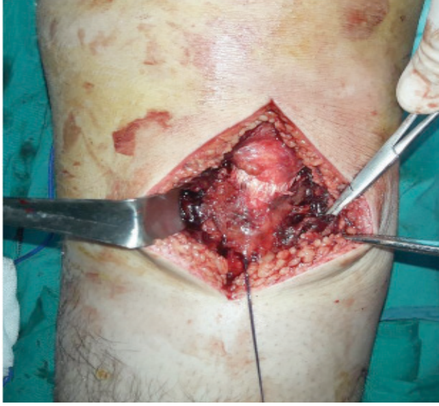
Resim 7. Patellar tendonun paratenonun altına çekilmiş hali