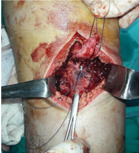
Resim 6. Patellar tendonun, paratenonun altına çekilmesi