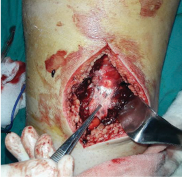
Resim 3. Paratenondan ayrılan patellar tendon