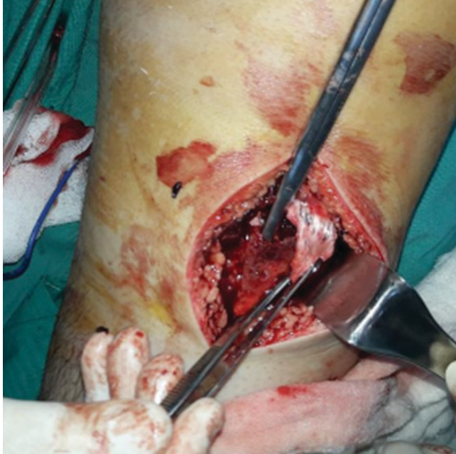
Resim 4. Sağlam olan paratenon: makasın ucu ile gösterilmiştir.