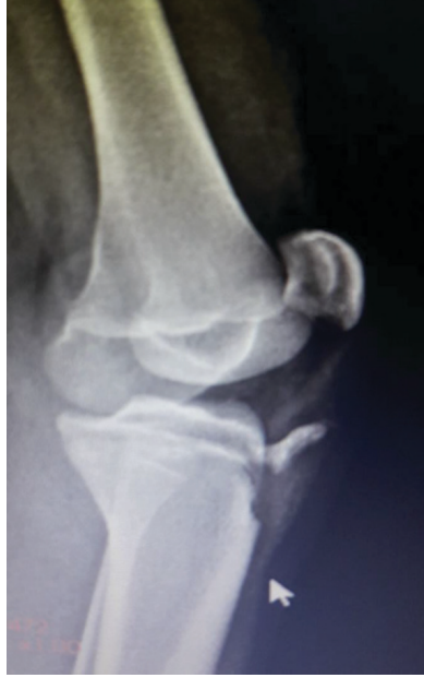
Resim 1. Hastanın preop röntgeni.