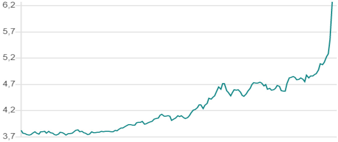
Şekil 4 Donald J. Trump'ın Türkiye'ye Yönelik Tweetinden sonra Türkiye'de USD Paritesi