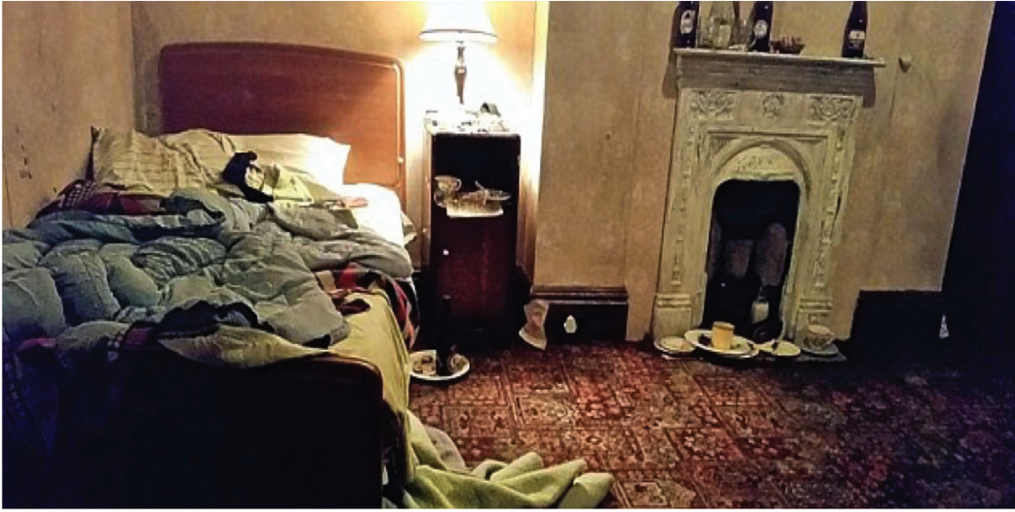
Görsel 4: Teşhircilik/Exhibitionism sergisinden görünüm, yıkanmamış çarşaflardan oluşan yatak ve şömüne içinde ve üzerinde boş bira kutuları, kahve fincanları.

(12. 02. 2018) https://www.google.com/search?newwindow