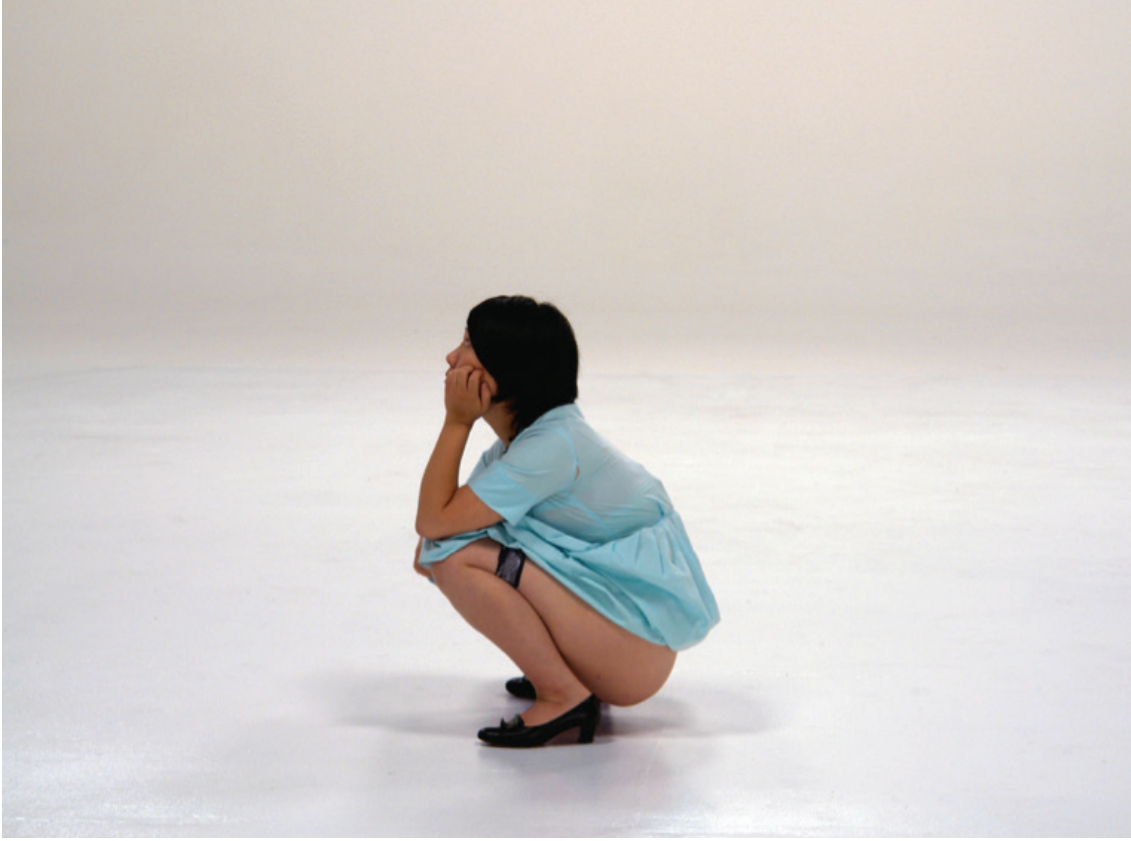
Görsel 6: Martin Creed, Beden Dökümanları, Shit/Body Docs, Dışkılama , 2008, video performans, https://www.google.com/search?q=Martin+Creed+Shitting&newwindow=1&source=Inms&tbm=isch&sa=X&ved=0ahUKEwjpr6TV717aAhXDNpoKHYe8DeQQ_AUICigB&biw=1440&bih=803#imgrc=VG4SNUArLa8q3M : (28, 03. 2018)

değil, kişisel mitolojiler belirleyici olur. Çağdaş sanat bu gelişmeler doğrultusunda "eğlence kültürü"nü içinde araçsallaşır. Fox Life ve Bravo TV kanalında yer alan Sex and The City dizisiyle şöhret olan moda ikonu Sarah Jessica Parker, "Work of Art: The Next Great Artist" adlı bir yarışma programında yer alır. Yarışmayı düzenleyen Bravo TV'nin üst düzey yöneticisi yemek, moda, saç ve içmimarî tasarımı ile yaptıkları benzer formattaki diğer programları sanat için de yapabileceklerini kanıtlamak istediklerini belirtir. Tanıtımlarında sanat sektöründeki en iyilerin bir arada olduğu ve sanat koktuğu iddia edilen programın amacı, 14 sanatçı adayını Brooklyn Müzesi'nde karşı karşıya getirmektir. Yarışmayı kazananın hatırı sayılır para ödülüyle ödüllendirildiği bir formatı vardır. Yarışmacılara programda