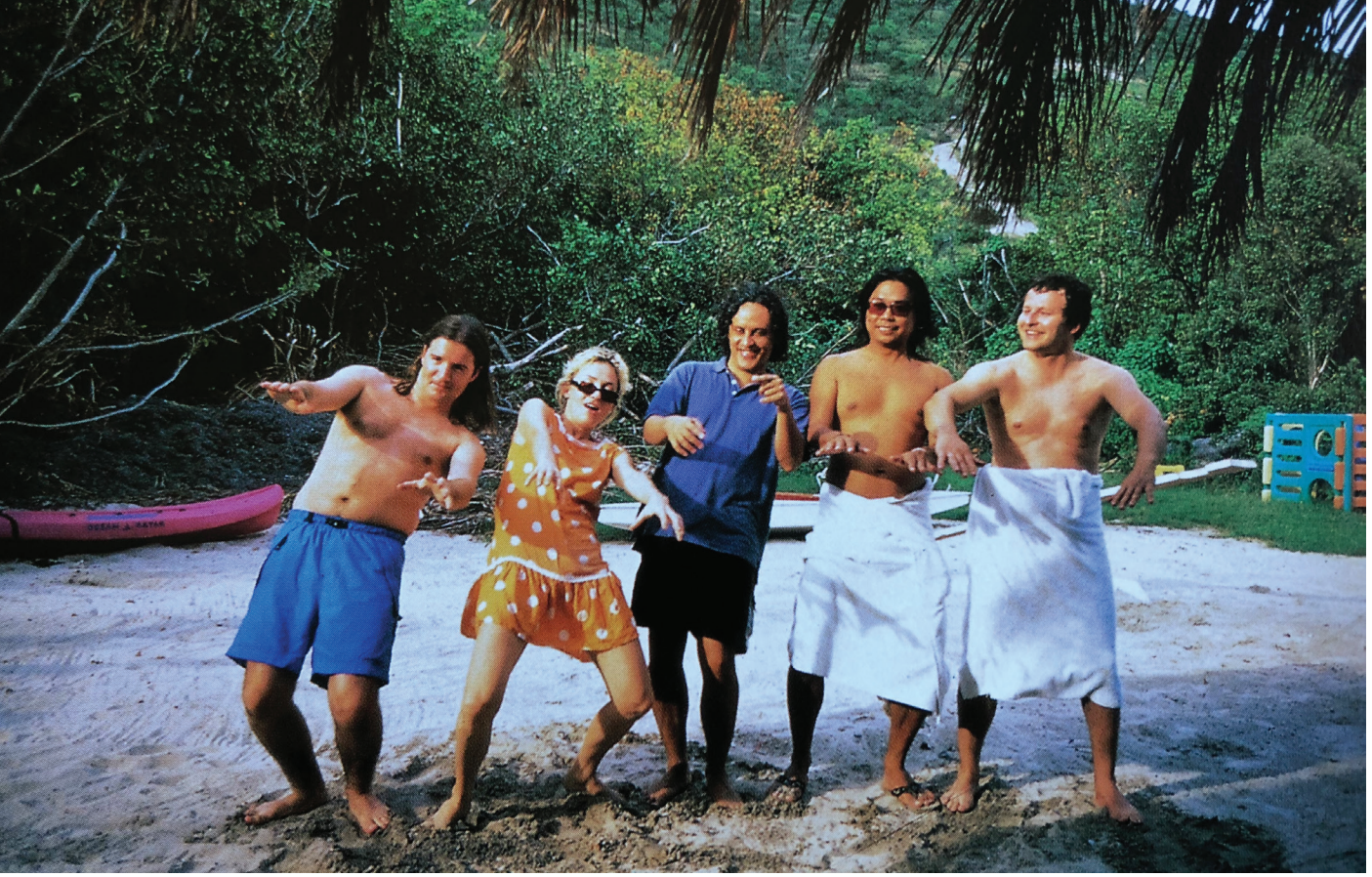
Resim 2: Katy Siegel-Paul Mattick, Money, 2004, Thames and Hudson, London, 72. (6. Karayipler Bienali'ne katılan sanatçıları adada eğlenirken gösteren fotoğraf)

gurularının keşifleri sayesinde "şöhret" ve "popülerlik"e eviriliyor.