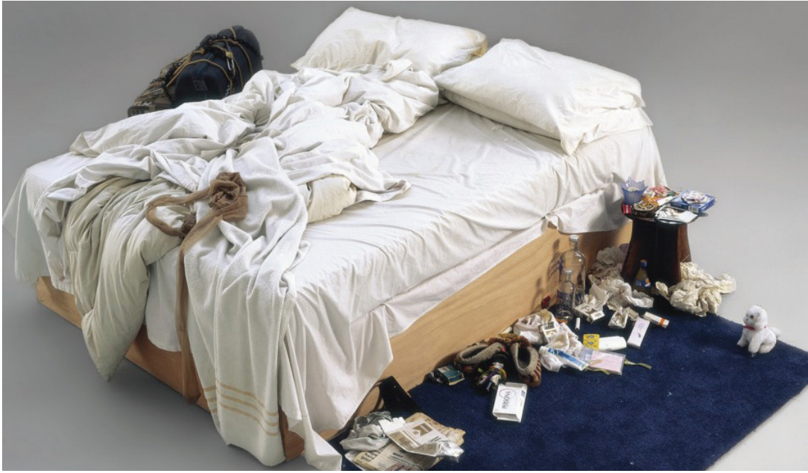
Görsel 3: Tracey Emin, Yatağım / My Bed , 1998, https://aleteia.org/2013/08/02/art-review-tracey-emin-my-bed/ (15. 03. 2018,)

Yukarıda bahsettiğimiz Giotto ve Cimabue arasındaki mitsel söylence, modern kapitalizmle birlikte Saatchi ve Tracey Emin arasında “spekülatif mit” olarak kurulur. Başarı sansasyon ile özdeşleştirilir. Reklam gurusu Saatchi, Emin’in “Yatağım” (1998) adlı işini olduğu gibi satın alır. Üzerinde kan lekeleri olan iç çamaşırları, prezervatifler, şırıngalar vs, bir sevişme sahnesini betimlemek üzere mevcut her türlü ıvır zıvır olduğu gibi sanatçının yatağı mitosuyla sergilenir. Emin bir söyleşisinde kendisine, “Bu yatağı sanat yapan şey nedir?” diye soran izleyiciye, “Onda ben yattım” yanıtını verir. Giotto’yu oradan geçerken keşfeden Cimabue mitinin yerini, günümüzde Emin’in yatağını satın alarak şöhret yapan Saatchi almıştır. “Deha”nın yarattığı büyük öyküler, “şöhret”in kişisel mitolojilerine kaymıştır.