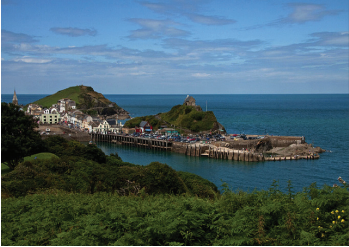
Görsel 5: Damien Hirst, Eko Köy Projesi, Ilfracombe, Devon, Birleşik Krallık. https://www.google.com/search?q= Damien+ Hirst, +Ilfracombe,+Devon,&newwindow=1&source=Inms&tbm=isch&sa=X&ved=0ahUKEwjDk7mC7I7aAhVCJ5oKHfeUCkQQ_AUICigB&biw=1440&bih=803#imgrc=fiQUR9YGjm0zCM: ( 07. 03. 2018)

Eğlencenin sanatsallaşması ya da sanatsallaşan eğlencede “vurucu iş” olgusu Hito Steyerl’in geliştirdiği “vurucu iş” kavramı, günümüz kültür ve eğlence dünyasında dikkat çekmenin belki de en önemli anahtarından birisi. Steyerl, “vurucu iş”e özel bir önem atfeder. Terim, “çok üretken ve coşkulu çalışma” anlamlarında kullanılan udarny trud deyişinden türetilmiştir ( Udar , şok, vurucu, çarpıcı demek). Günümüz kültür fabrikalarına uyarlandığında ise vurucu iş daha çok şokun duyusal boyutuyla ilişkili. Günümüzde sanatsal vurucu iş, tuval boyamak, kaynak yapmak ya da çamur yoğurmaktan ziyade; onu bunu küçümseyerek, çene çalarak ve poz keserek yapılıyor. Vurucu işçiler hisleri, algıları ve seçkinliği, akla gelebilecek her tür ve ebatta seri üretirler. Doluluk ya da boşluk, yüce ya da saçma sapan, hazır-nesne ya da