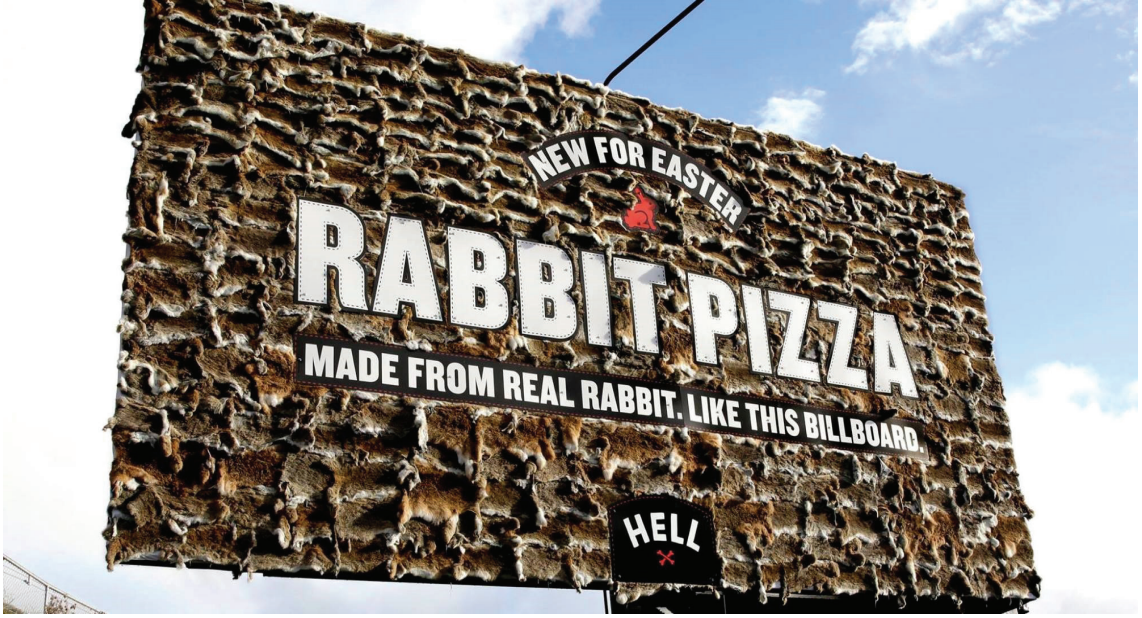
Resim 11. Hell firması, 'Rabbit Pizza Billboard Tasarımı'.

hem cebe hitap edebilmesi açısından pizzanın görseliyle beraber fiyatı da yazmaktadır. Tüketici oraya yönlendiğinde ne kadar fiyata ne yiyebileceğini önceden bilmektedir.