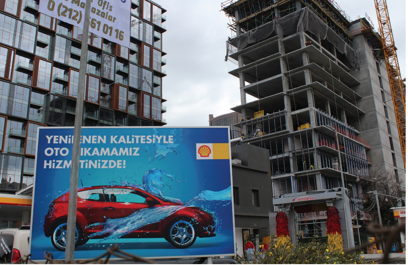
Resim 7. Benzinlik reklamı, Ataköy. (Bülbül, 2018).

şekilde olmalıdır (Üsterman, 2009: 24-25). Açık hava reklamları sade, anlaşılır, büyük vurgular ve doğru renk kullanımıyla çarpıcı olacak şekilde hazırlanmalıdır.