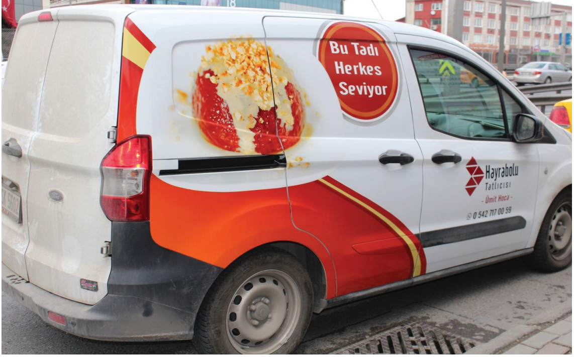
Resim 5. Araç giydirme, K.çekmece. (Bülbül, 2018).

Değişen ve gelişmekte olan günümüz reklam sektöründe müşteriye o ürünü satın gelir kazanmak yanında geri dönüşümleri değerlendirmek, yeni talepler elde etmek ve kulaktan kulağa pozitif yayılım sağlamak markanın prestijini artıracaktır.