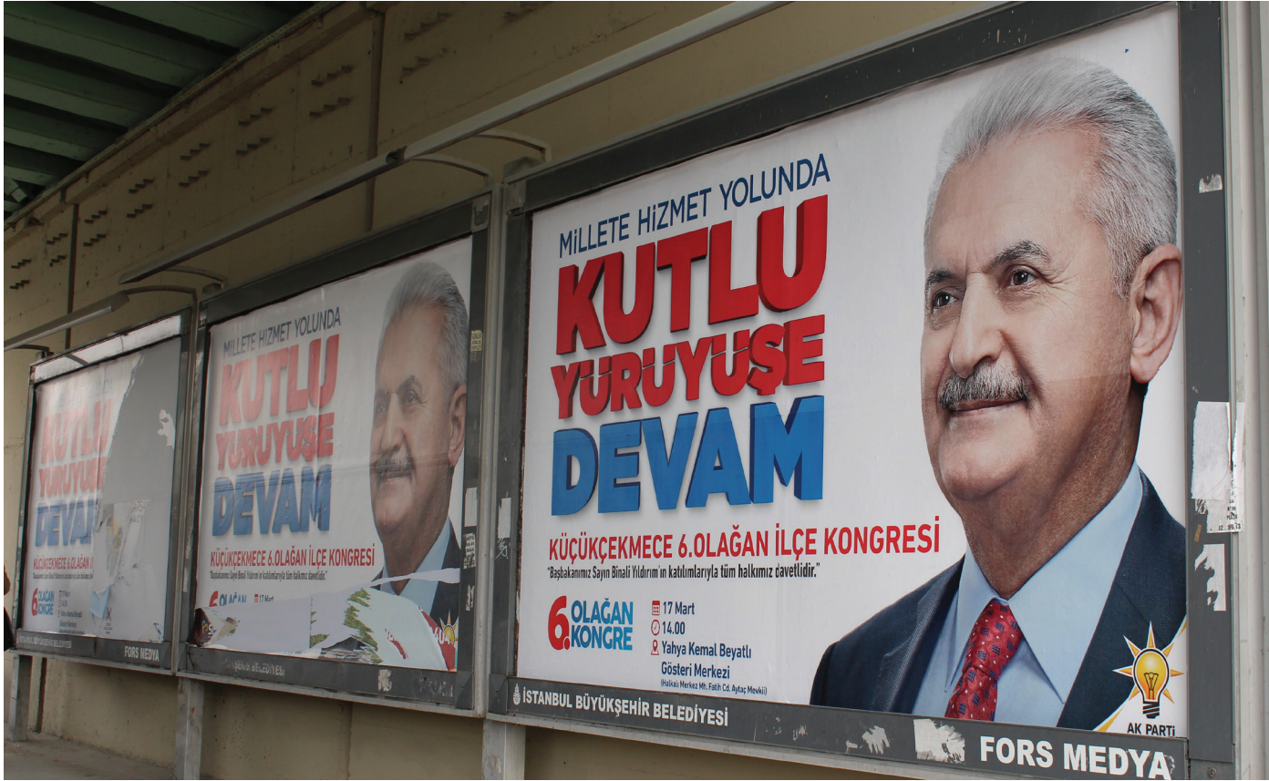
Resim 8. Köprü altı siyasi reklam, Yenibosna. (Bülbül, 2018).

Grafik tasarım görsel bir alandır. Tüm yazı, resim, şekil, renk, sembolleri içermektedir. Grafik tasarım bu nedenle birçok teknik ve disiplinle oluşturulmaktadır. Bu teknik ve disiplinleri kullanarak izleyene mesaj iletilmektedir. Grafik tasarımda en temel olarak sözcük ve resimler vardır. Bir kavramı, bir mesajı görsel yolla tipografik veya resimsel olarak aktarmayı amaçlamaktadır. Grafik