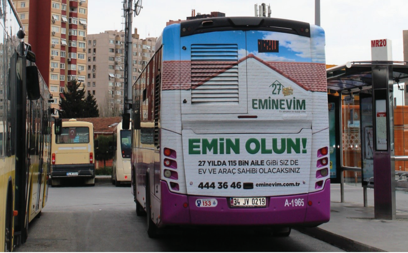
Resim 6. Otobüs giydirme, Ataköy. (Bülbül, 2018).

aracında kitlenin anında mesajı alması beklenmektedir. Sokakta koşarken, araba sürerken, tramvayda giderken yani günlük yaşamda, dışarıda koştururken reklamın saniyeler içinde iletilmesi istenir. Bu sürede reklamın tekrarlanma şansı yoktur ve uzun zaman incelenme fırsatı bulunmamaktadır. Bu sebeple markanın/ürünün doğru şekilde algılanması söz konusudur.