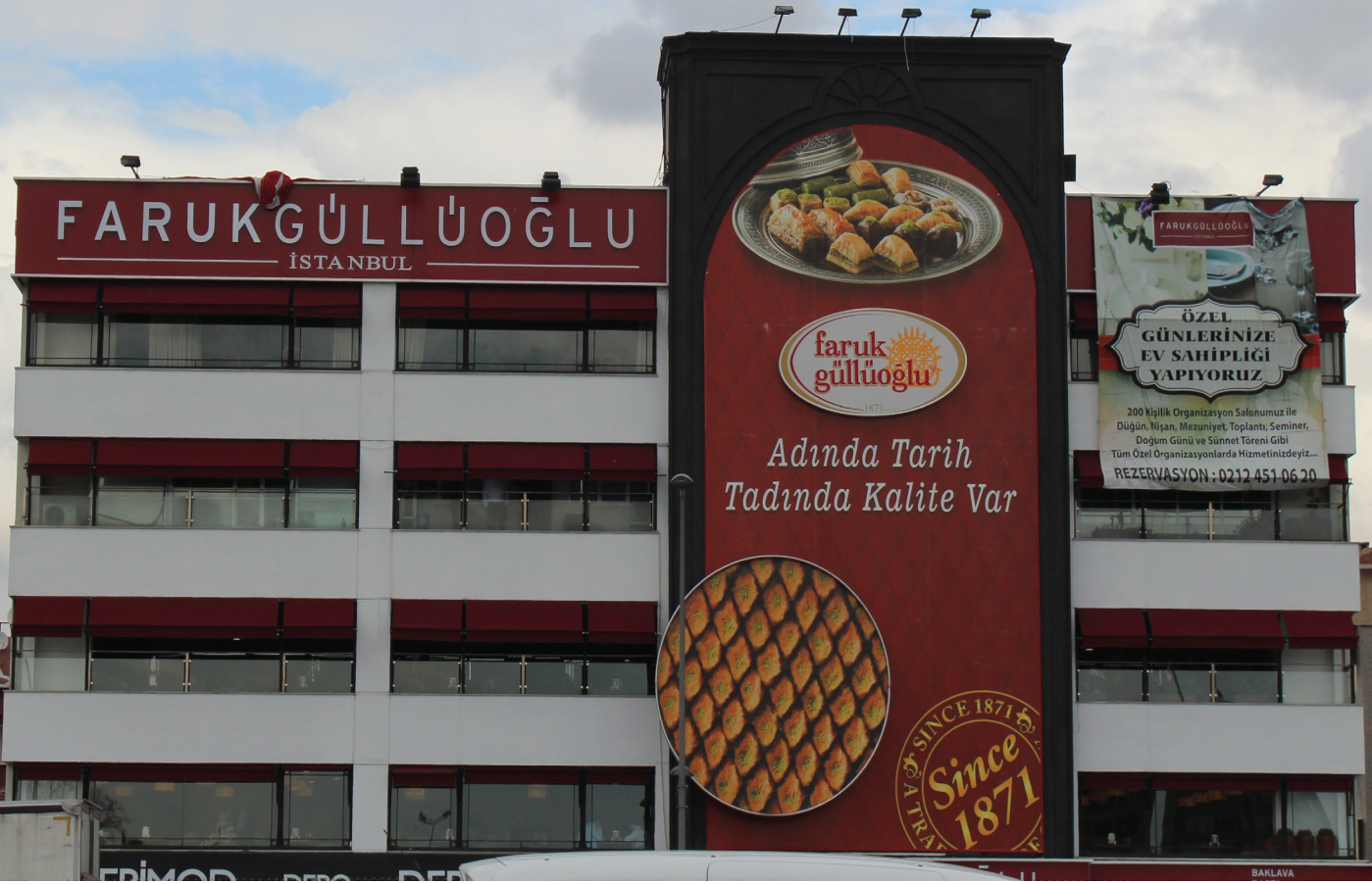
Resim 3. Bina giydirme reklamı, Yenibosna. (Bülbül, 2018).

fazla güç kaybetmemiştir. Reklamcılar ve marka sahipleri müşteriye ulaşmanın yolunu, bulunduğu zamanın imkânlarına ve toplumun kültürel yapısına uygun olarak hazırlamıştır. Reklamcılıkta tanıtımın yol ve yöntemlerini kullanarak müşteri ile ilişki kurma ve onlara sosyal, ekonomik ve psikolojik yönden ulaşabilme amaçlanmaktadır. Pazarlama yönteminde müşteriye çeşitli alternatifler sunularak onlara istediğini seçmekte özgür olma hissi yaratmaya çalışılır. J. K. Galbraith; 'ikna edici' reklamın sonucunu 'bağımlı etki' kavramıyla açıklamaktadır. Tüketici kendi ihtiyaçlarına karşılık değil de reklamı yapılanaya karşı istek duymaktadır. Reklamcılar tüketiciden aldıkları dönütlerle yeni ihtiyaçlar yaratarak müşteriyi doydurmayı amaçlamaktadır. Reklamcılıkta görsel ve psikolojik algı, benimsenen ahlaki ve kültürel değerler, toplumun alım gücü tanıtım ve pazarlama sürecini yönlendirmektedir.