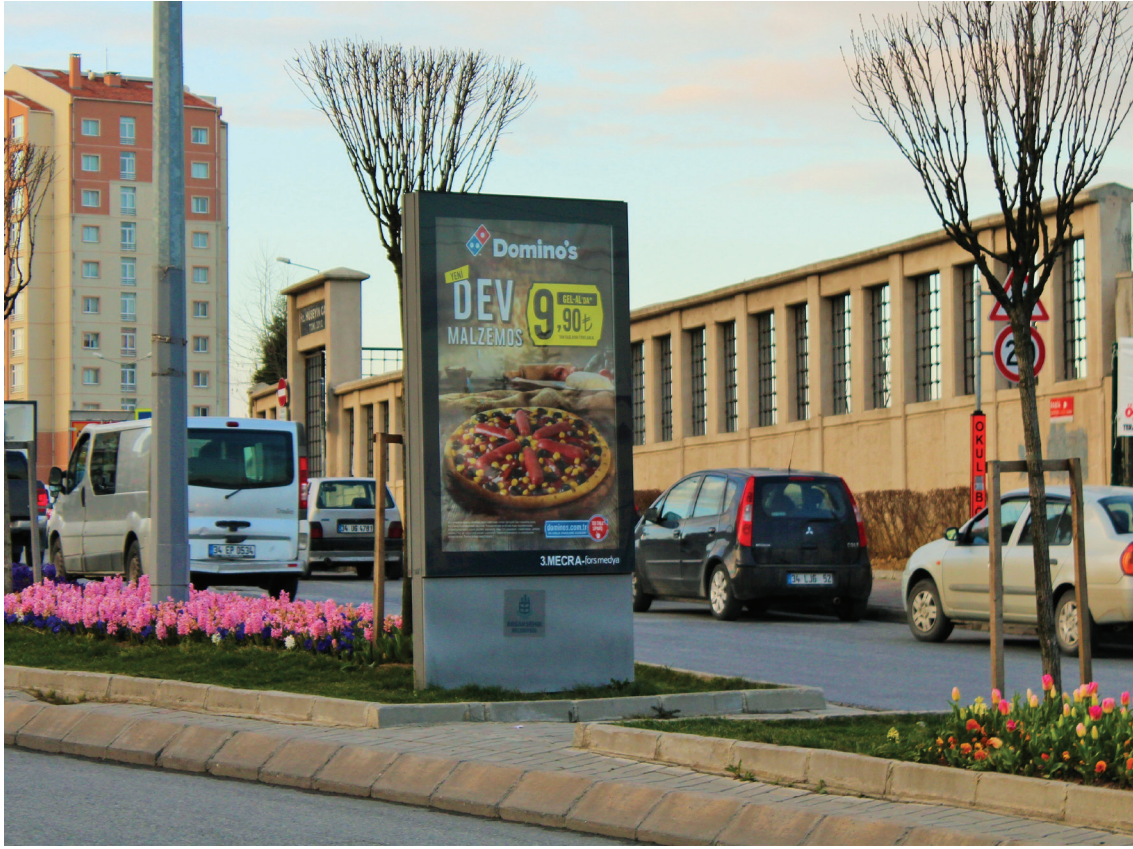
Resim 4. Cadde kenarında hızlı yemek reklamı, Kayaşehir. (Bülbül, 2018).

geliştirmeyi amaçlamaktadır. Tanıtım araçlarından broşür, afiş, haber bülteni vs. gibi iletişim ve etkinlik alanlarını düzenlemektedir. Halkla ilişkiler uzmanı kurumun saygınlığını artırmak için çabalarken aynı zamanda iletişim yeteneği kuvvetli, araştırma merakı olan, girişken ve toplumun nabzını tutan özelliklere sahip olmalıdır.