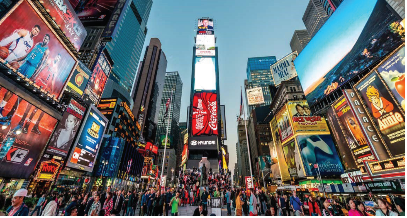
Resim 1. Kent içi açık hava reklamları ( https://www.york.ac.uk/study/undergraduate/courses/bsc-marketing/ )