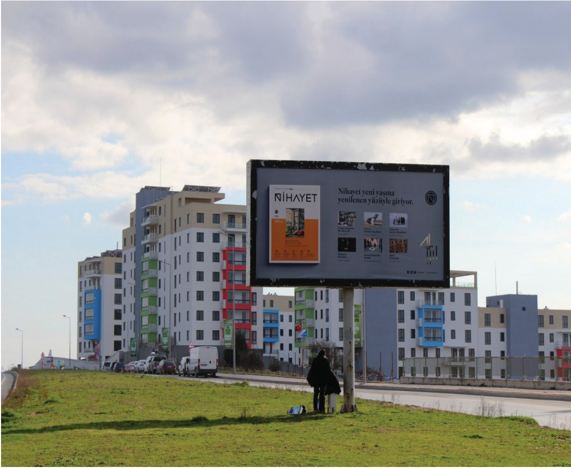
Resim 2. Cadde kenarında bir reklam panosu, Başakşehir. (Bülbül, 2018).

Beasley ve Danesi (2002: 9) reklamın 'sanat' olduğu görüşündedir. Reklam bir sanattır, çünkü reklamlar bireylerin ürün ya da hizmeti nasıl algıladıklarını saptamak ve etkilemek üzere tasarlanmış estetik teknikler bütünüdür. "Modern toplumlarda reklam, sosyalleşmenin kurumsal bir aracı olarak var olur ve endüstriyelmiş Batı toplumlarının resmi sanatıdır" (Williams, 2003: 4).