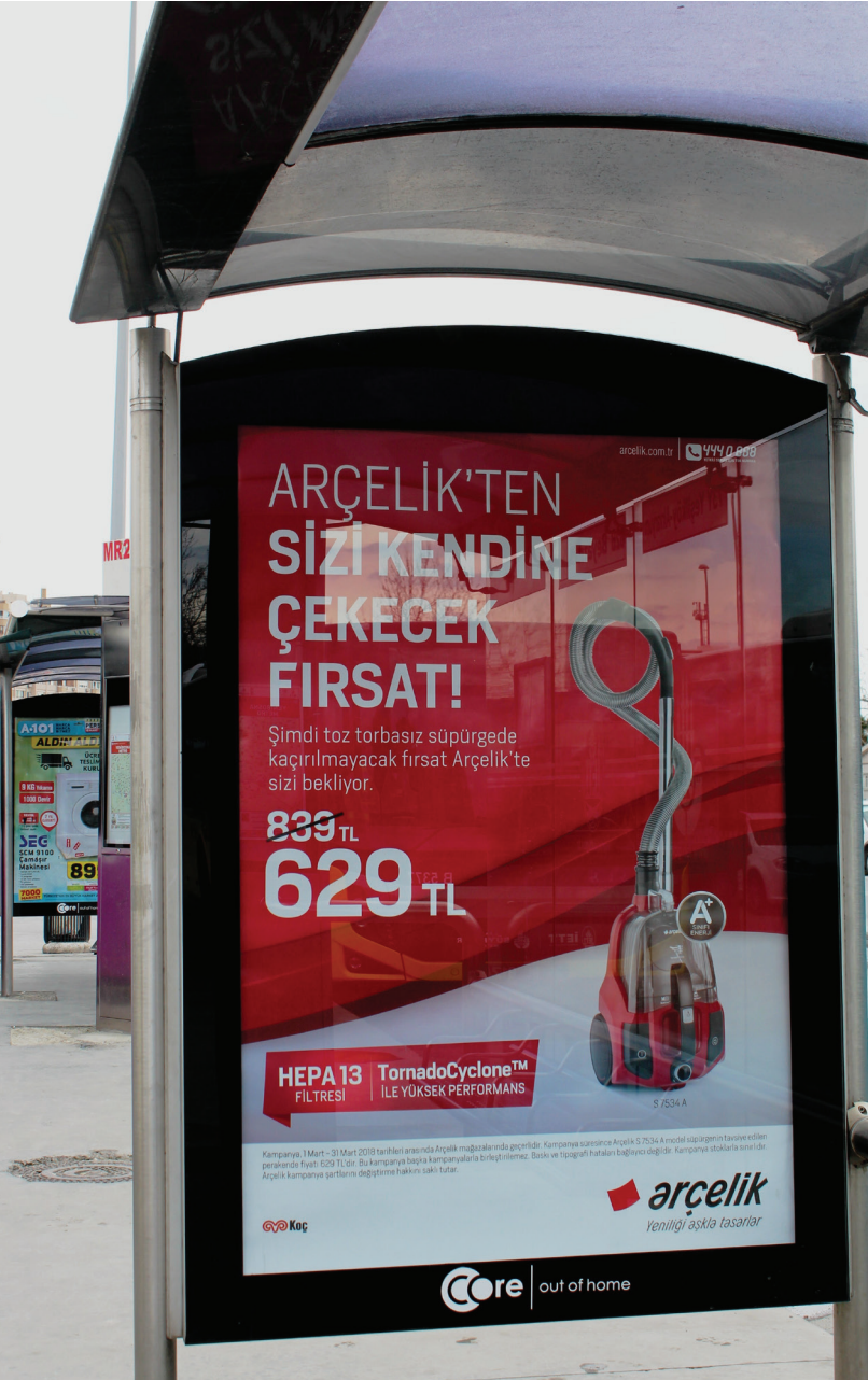
Resim 9. Otobüs durağı reklamı, Yenibosna. (Bülbül, 2018).

1) Çizgi: Bir tasarımda kullanılan çizgiler izleyene optik yanılsama verebilir. Grafikte kullanılan çizgiler çeşitlerine (yatay, dikey, eğik vs.) göre bazı mesajlar iletmektedir.