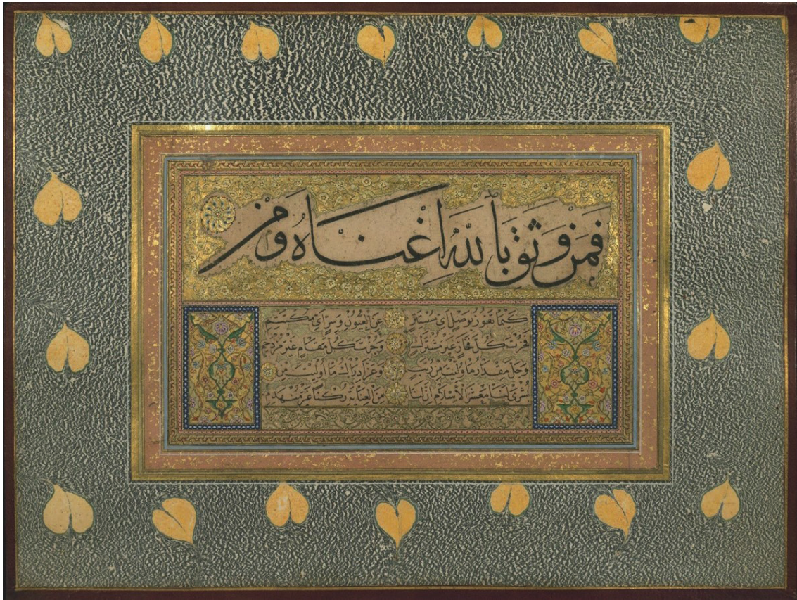
Resim 2. Hatip Ebrusu