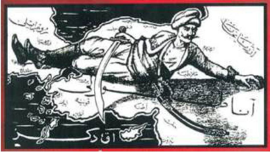
Resim 7. Şefik Özdemir Bey müfrezesinin güzergâhı