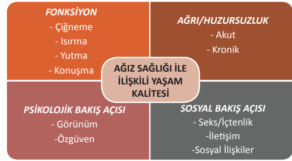
Şekil 1: Ağız Sağlığı İle İlişkili Yaşam Kalitesi Kavramı İle İlgili Faktörler

Ağız sağlığı, bireylerin fiziksel, sosyal ve ruhsal sağlık düzeyleri ile ilişkilidir ve genel sağlığın ayrı bir boyutunu oluşturmaktadır. Ağız sağlığı ile genel sağlık algısı ve ruhsal sağlık arasında pozitif bir korelasyon, fiziksel sağlık ile ise negatif bir korelasyon olduğu bulunmuştur. Ağız fonksiyonlarındaki bozukluk ve sağlıksız dişler, ağrı ve rahatsızlık gibi şikâyetlerin yanında bireylerin yaşamsal kapasitelerini, sosyal yaşamlarını ve psikolojik durumlarını olumsuz yönde etkileyerek yaşam kalitesini de etkilemektedir 18 (Şekil-1).