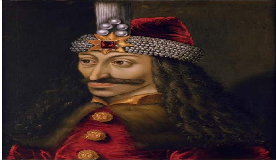
Şekil 4.3: Kazıklı Voyvoda III. Vlad Resim

Dünyaya vampir efsanesini tanıtan, Bram Stoker’ın 1897’de yayınladığı “Drakula” romanıdır. Vampirlerin yaşayış şekli ve özellikleri Drakula’da ifade edilmiştir. Kont Drakula; vampir olduğu öne sürülen Kazıklı Voyvoda’ nın hayatına göre uyarlanmıştır. Sinemanın ilk dönemlerinde edebi eserlerden yararlanmıştır. Drakula efsanesini de sinemaya taşımıştır.