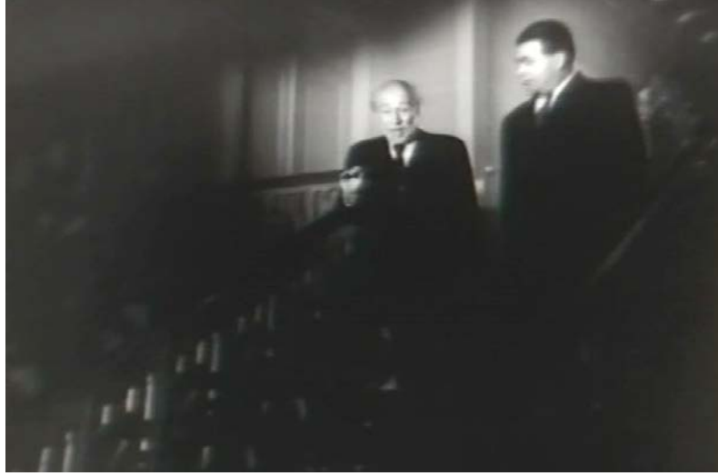
Şekil 5.14: Drakula İstanbul’ da Filmi Doktor Naci ve Doktor Akif Karakteri Resim