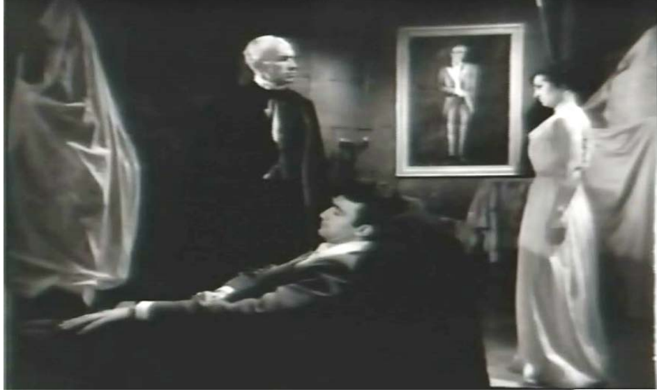
Şekil 5.4: Vampir Kadın, Azmi ve Drakula' nın Beraber Olduğu Sahne (Genel Plan)

Boy plan, diz plan, bel plan ve göğüs plan, karşılıklı konuşmaların olduğu sahnelerde yoğun olarak kullanılmıştır. (Azmi' nin Bistriç Oteli' ne gelip, Drakula' nın bıraktığı mektubu okuduğu sahne) Hem yüzün hem de ellerin görülebildiği bel planlar kullanılmıştır. Birçok sahnede farklı planlar ard arda kullanılmıştır.