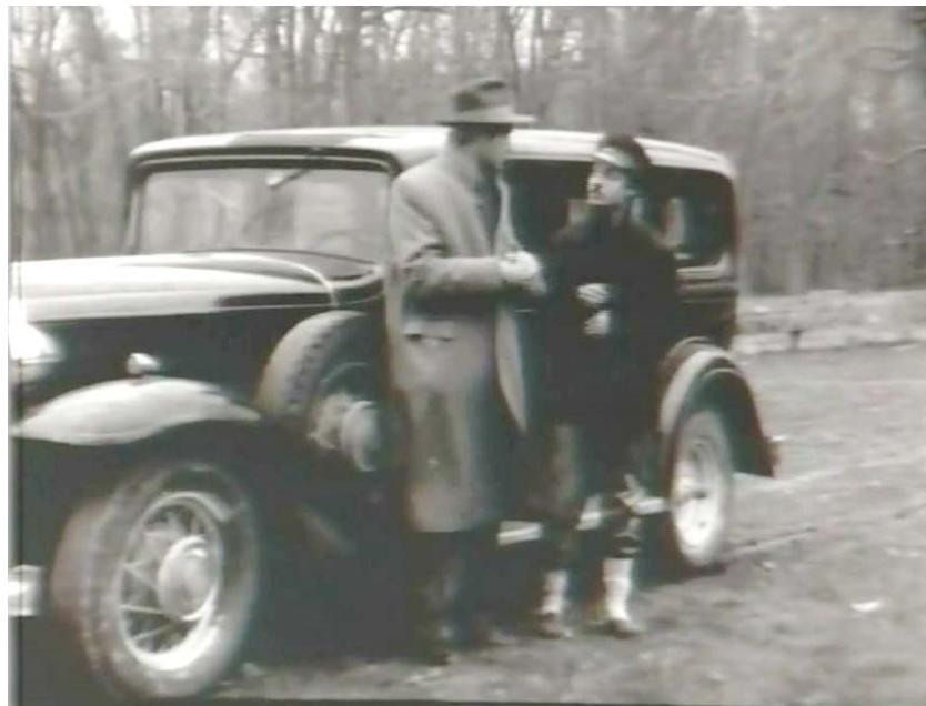
Şekil 5.18: Drakula İstanbul' da Filmi Şoför Karakteri Resim

Şoför: Azmi' yi Drakula ile buluşma noktasına götüren bir adamdır. Biraz korkak ve paragözdür. Azmi' den aldığı fazla bahşişle işi kabul etmiştir. Azmi' ye destek veren karakterler arasındadır. Filmde iç otel ve dış mekân olarak rol almış bir karakterdir.