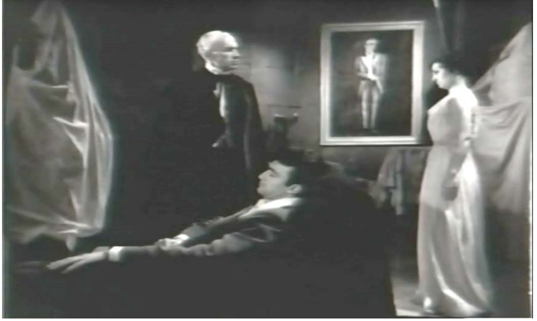
Şekil 5.19: Drakula İstanbul' da Filmi Vampir Kadın Karakteri Resim

Vampir Kadın: Drakula' nın vampir yaptığı bir kadındır. Beyaz elbiseli, orta boylu, toplu saçlı, hafif toplu kilolarda genç ve güzel bir kadındır. Drakula Şatosu' nda; Azmi' yi mahzende bayıltıp ısırmaaya çalışırken, bu eylemini Drakula' nın oraya gelmesi ile gerçekleştirememiştir.