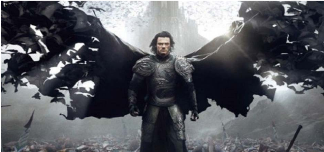
Şekil 4.4: Dracula: Başlangıç Film Karakteri Resim

Dracula romanının Kont Dracula' sının; Vlad Tepeş' le örtüşmesi ve dünyaca ünlü bir korku kahramanı sunmasının yanı sıra kendisinden sonra üretilen eserlere ve sinema filmlerine örnek teşkil etmesi olmuştur.