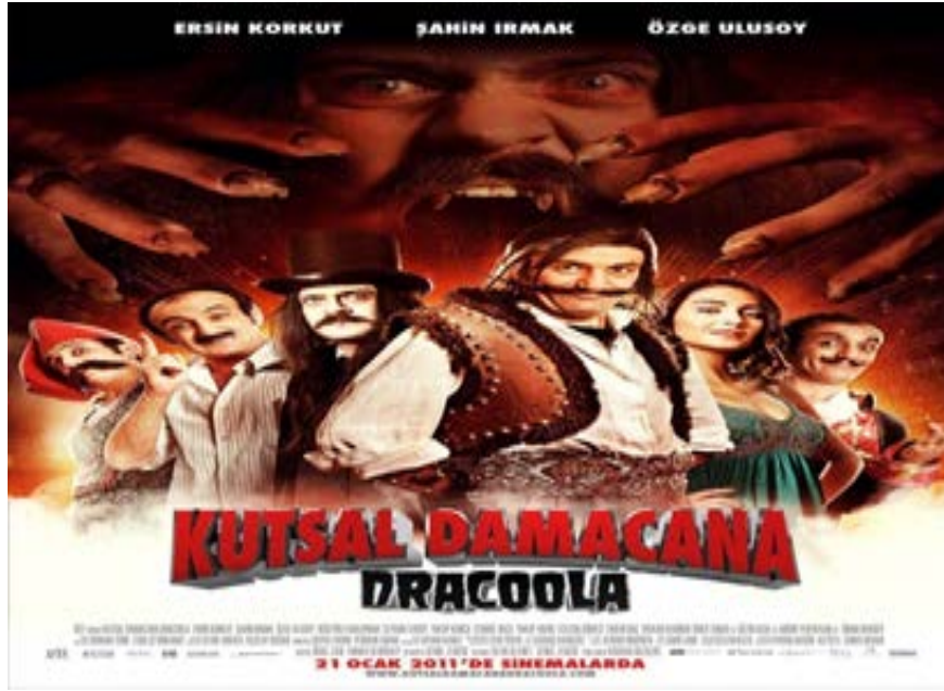
Şekil 4.11: Kutsal Damacana 3: Dracoola Film Kapağı