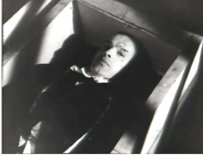
Şekil 5.8: Drakula' nın Tabutunda Uyanması (Üst Açı)