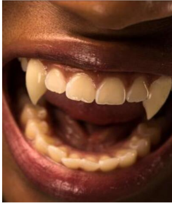
Şekil 4.6: Vampir Dişi Resim

Ortaçağ pek çok açıdan karanlık bir dönem olmuştur. Göç, kuraklık, kıtlık, veba salgını, amansız hastalıklar, dinsel gericilik olayları bu dönemde Avrupa'nın öne çıkan sorunları olmuştur. 14. yüzyılda bunların hepsi bir arada yaşanmış ve bu yüzyılın felaketler yüzyılı olarak anılmıştır. Yaşanan felaketler bu dönemle kısıtlı kalmamıştır, 16. yüzyılda açlık Avrupa' da çözülmemiş bir sorun olmuştur. 17. ve 18. yüzyıllar, Avrupa' da vampir hikâyelerinin yayıldığı ve vampir salgınlarının çok konuşulduğu dönem niteliğindedir.