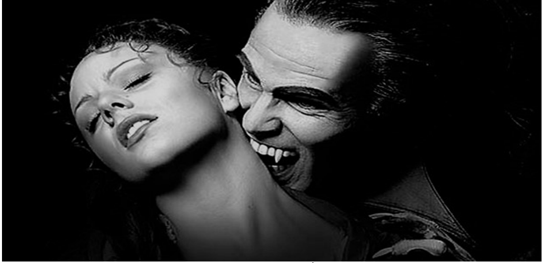
Şekil 4.1: Vampirlerle İlgili Resim