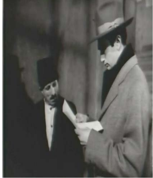
Şekil 5.16 ve 5.17: Drakula İstanbul' da Filmi Resepsiyondaki Kadın ve Kat Görevlisi Adam Karakterleri Resim