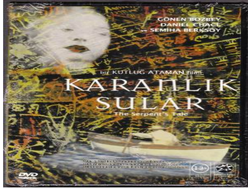
Şekil 4.10: Karanlık Sular (1995) Film Kapağı