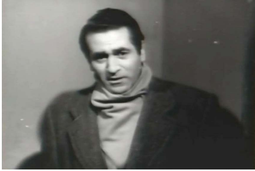
Şekil 5.13: Drakula İstanbul' da Filmi Turan Karakteri Resim

inanmayan zor karakterli bir adamdır. Üzerinde giydiği takım elbiseler onu resmileştirmiştir. Sert bir mizaca sahip saygılı bir beyefendidir. Nişanlısı Şadan' a büyük bir tutku ile aşıktır. Gelişen olaylar zincirinde ana karakterlere yardımcı olmuştur.