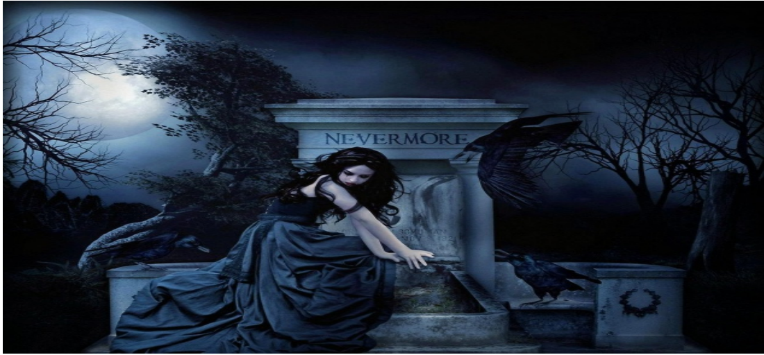
Şekil 4.7: Vampirlerle İlgili Resim