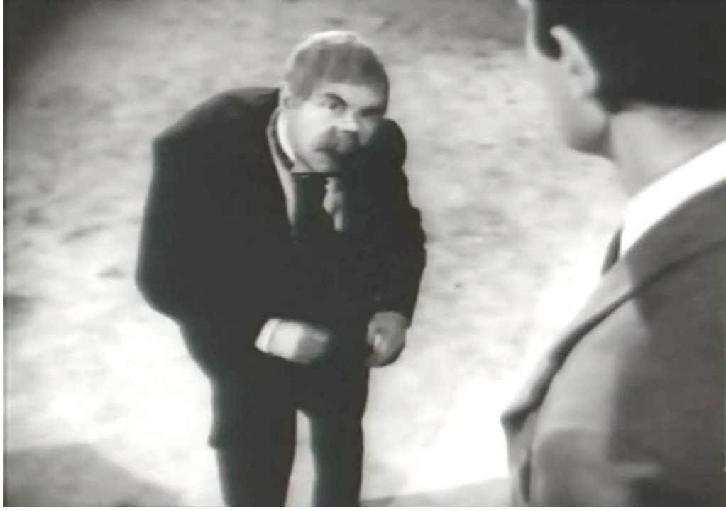
Şekil 5.15: Drakula İstanbul’ da Filmi Uşak Karakteri Resim