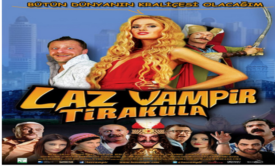
Şekil 4.12: Laz Vampir Tirakula Film Kapağı