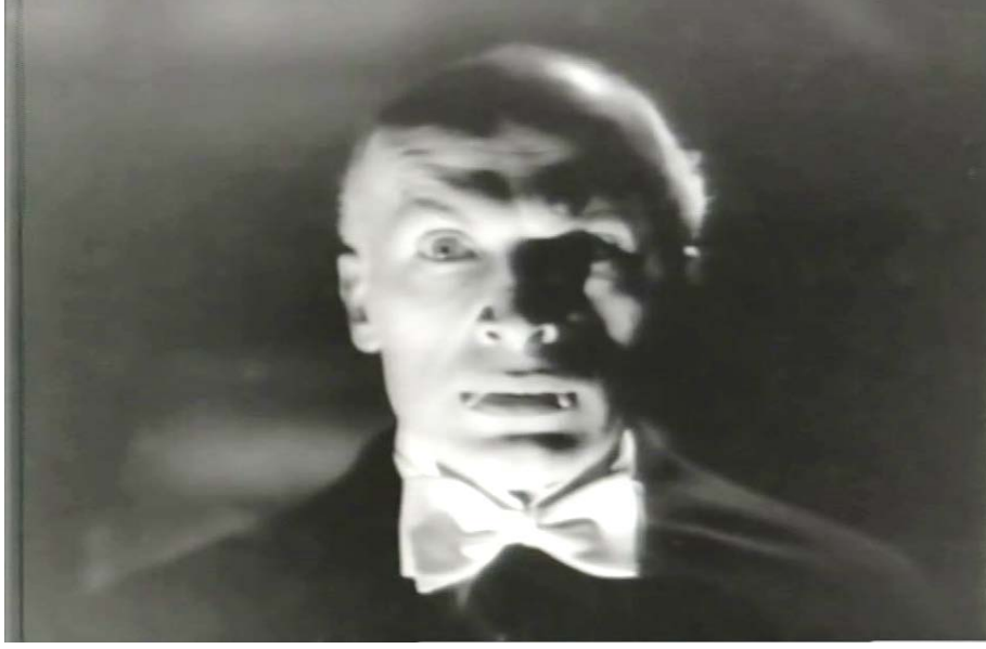
Şekil 5.9: Drakula İstanbul' da Filmi Drakula Karakteri Resim