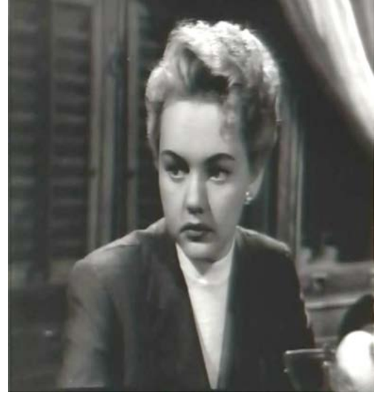
Şekil 5.11 ve 5.12: Drakula İstanbul' da Filmi Güzin Karakteri Resim