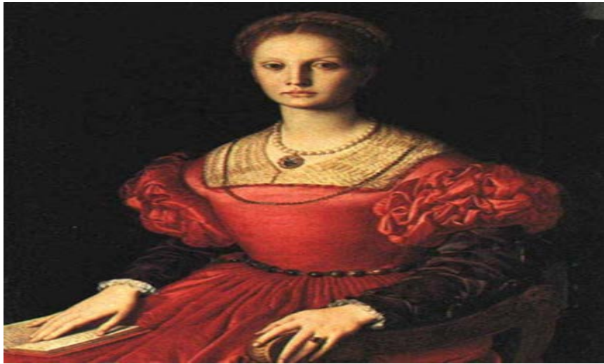
Şekil 4.5: Kanlı Kontes Elizabeth Bathory Resim

Vlad Tepeş' in aslında görünenin aksine bir halk kahramanı olması ve Osmanlı' ya karşı direnişi ile Hristiyanlık savunucusu olduğunu, siyasi tutumu ve sert tavrının dönemin koşulları içerisinde olağan davranışlar olduğunu, ülkesi için büyük bir çaba sarfettiğini açıklamaya çalışmıştır. Ayrıca; Vlad Dracula' nın savaş sırasında öldürülmesiyle cesedi başsız bulunmuştur. Başsız bulunan cesedin Snagov Manastırı' na gömülmüştür. Kesilen başın ise; Konstantinopolis' te halka gösterilmiş olmasıdır.