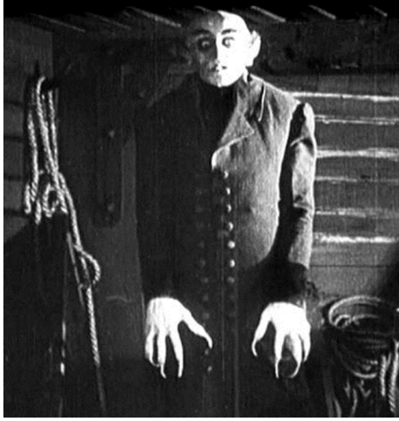
Şekil 4.2: Vampirle İlgili Resim