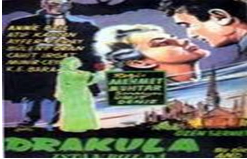
Şekil 5.1: Drakula İstanbul' da (1953) Film Kapağı