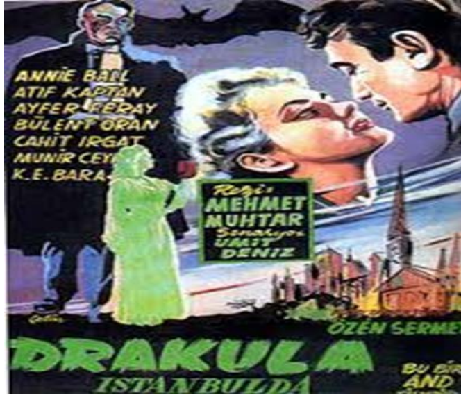
Şekil 4.9: Drakula İstanbul' da (1953) Film Kapağı