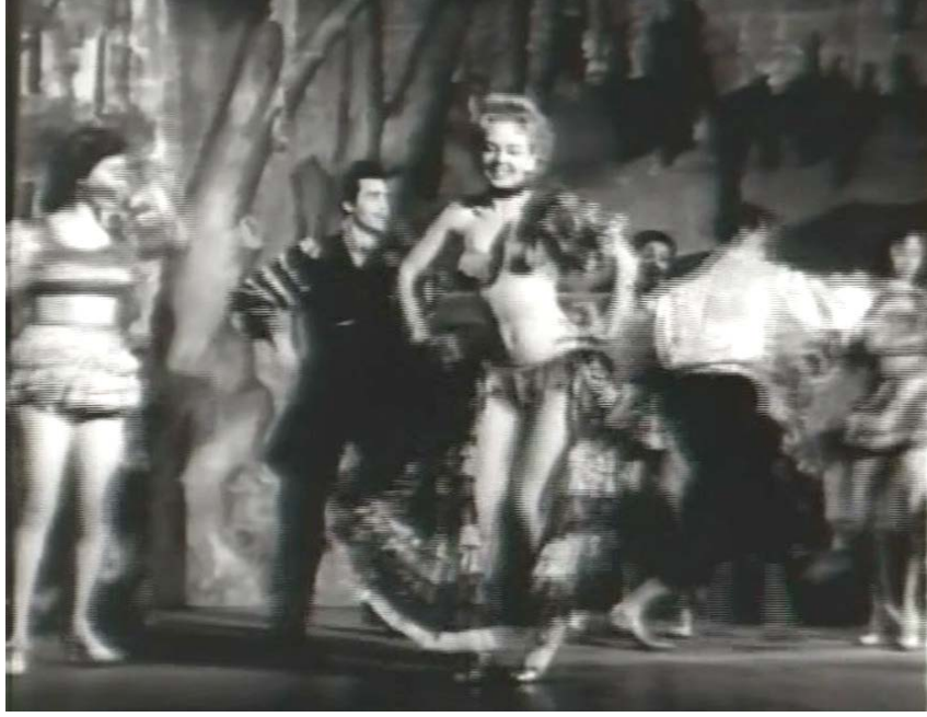
Şekil 5.20: Drakula İstanbul’ da Filmi Dans Grubu Karakterleri Resim