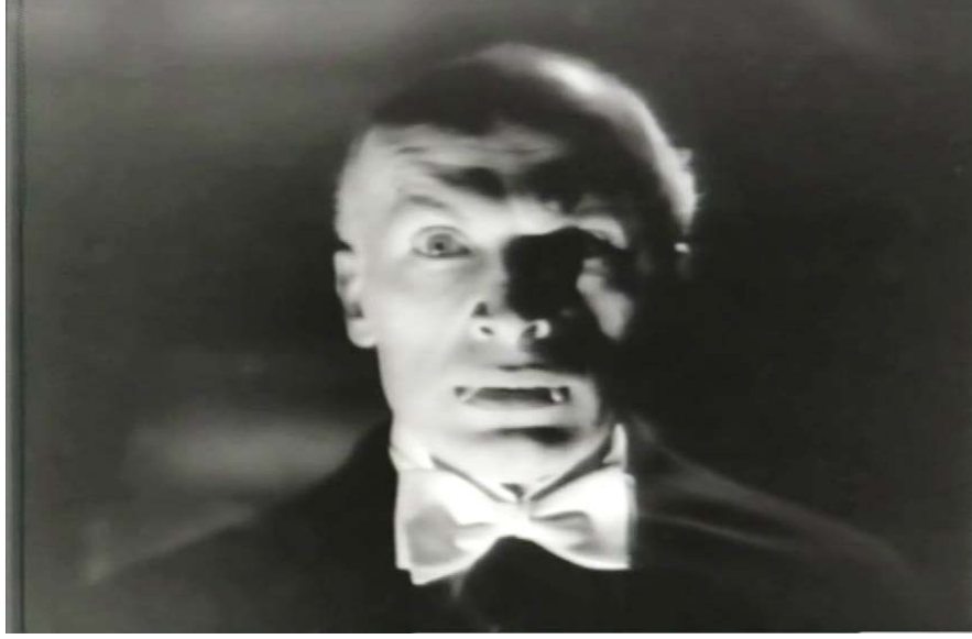
Şekil 5.2: Drakula İstanbul' da Film Karakteri (Yakın Çekim- Baş Plan)