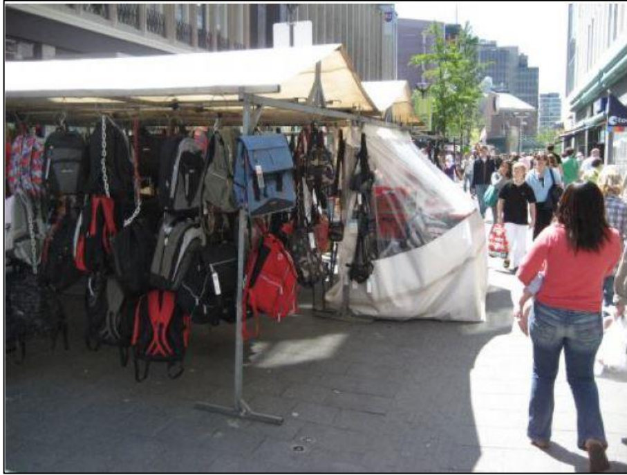
Şekil 5.2: Rotterdam Cadde İşgali

Lokanta, manav, mağaza gibi yerler dışarıda işgal yapabiliyor. Yaya alanlarına geliş geçişi engellemeyecek şekilde belirli miktarda işgaliye parası alınarak izin veriliyor. Bunlara da belirli bir ölçüde (1-1,5 m2) gibi izin veriliyor. Tenteler içinde belli mesafe de izin veriliyor. Kurallara uymayanlara zabıta ceza yazıyor. Eğer bir işyeri belli bir sebepten ceza alarak günlük kapatılacak ise buna Belediye Başkanı karar veriyor. (İ.B.B Rotterdam Ziyareti 2008)