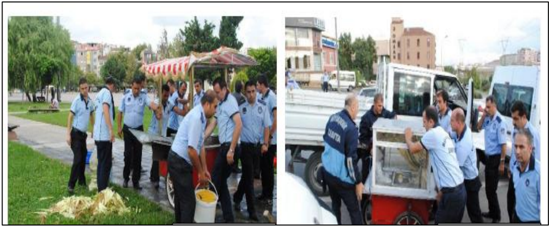
Şekil 4.8: İBB Zabitanın Seyyar Satıcıları Faaliyetten Men Etme Çalışmaları

Ülkemizde bu tür satıcıları doğrudan ilgilendiren yasalar bulunmamasına rağmen, dolaylıda olsa seyyar satıcılığı yasaklayan ve izinsiz satışlar ile ilgili idari yaptırım ön gören düzenlemeler yer almaktadır.