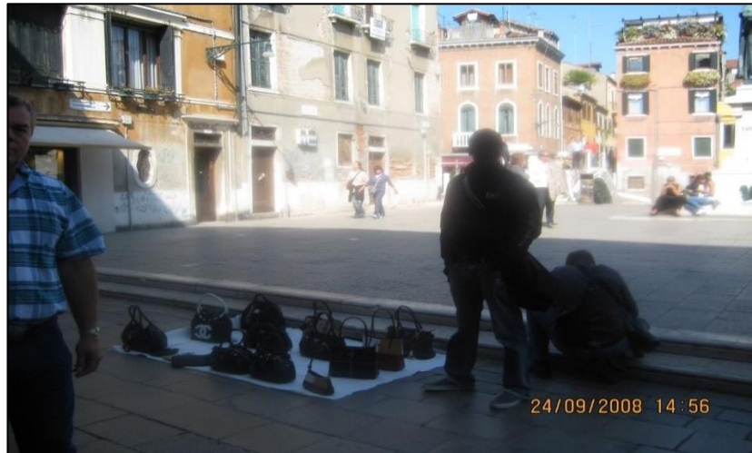
Şekil 5.6: Venedik Caddelerinde Seyyar İşgalleri

Venedikte izin alınmadan seyyar satıcılık yapmak yasak olup seyardan alınan malzemeler kesinlikle iade edilmiyor ve izinsiz satış yaptığından ceza yazılıp gerekirse mahkemeye sevk edilene kadar (48 saat süreli) göz hapsinde tutuluyor. Mahkemece 1,5 yıla kadar hapis cezası verilebiliyor. Seyyarlar retina okumalı bilgisayar takip programı ile takip ediliyor. Yılda 50 bin adet seyyar malına el konuluyor. (Venedik Ziyareti 2008)