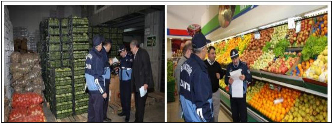
Şekil 4.9: İBB Zabıtanın Yaptığı Sebze Meyve Denetimleri

Özel toptancı hallerindeki zabıta hizmetlerini ve zabıta denetimlerinin yerine getirilebilmesi için 5957 Sayılı Kanunun 9 uncu maddesi gereği yeterli sayıda hal zabıtası görevlendirilir.