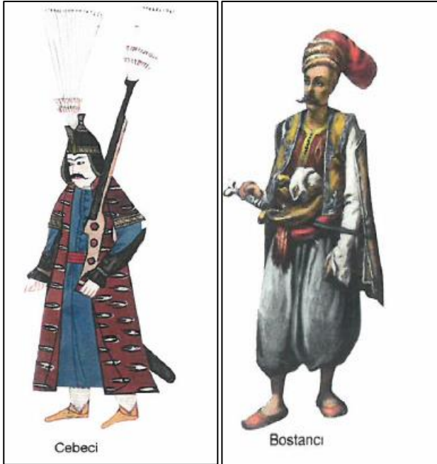
Şekil 2.2:Osmanlı Döneminde Cebeci ve Bostancı