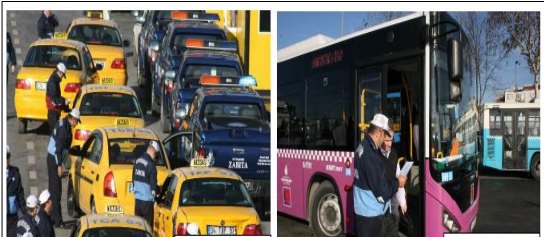
Şekil 4.10: İBB Zabıtası tarafından yapılan Toplu Taşıma Araç Denetimleri

Encümenin vermiş olduğu karar idari para cezasının yanı sıra yaptırım da içerebilir. Bu durumda emredilen fiilin, encümenin vermiş olduğu süre zarfında ilgili kişi tarafından yerine getirilmesi beklenir. Eğer verilen süre zarfında fiilin gereği yapılmaz ise belediye zabıtası tarafından yerine getirilerek veya getirtilerek masrafları %20 fazlası ile ilgisinden tahsil edilir.