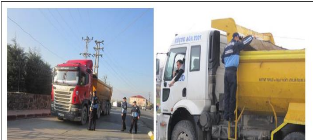
Şekil 4.2: İBB Zabıtanın Kaçak Hafriyatı Önlemeye Yönelik Denetimleri

Bu nedenle belediye zabıtası hafriyat toprağı ya da inşaat atıklarını taşıyan gerçek ya da tüzel kişileri denetlemekle görevli ve yetkilidir. Belediye zabıtası yapmış olduğu denetimlerde kanun ve yönetmelikte belirtilen usul ve esasların yerine getirilip getirmediğini denetler. Denetim sonucunda kanun ve yönetmeliğe aykırı hareket eden gerçek veya tüzel kişiler hakkında tespit tutanağı düzenleyerek, çevre denetimi ile ilgili yetki devri yapılan birime bu tutanak gönderilir. Belediye zabıtası yapmış olduğu tespit delillerini de (fotoğraf, kamera çekimi vb.) tespitle birlikte ilgili birime göndermesi gerekmektedir.