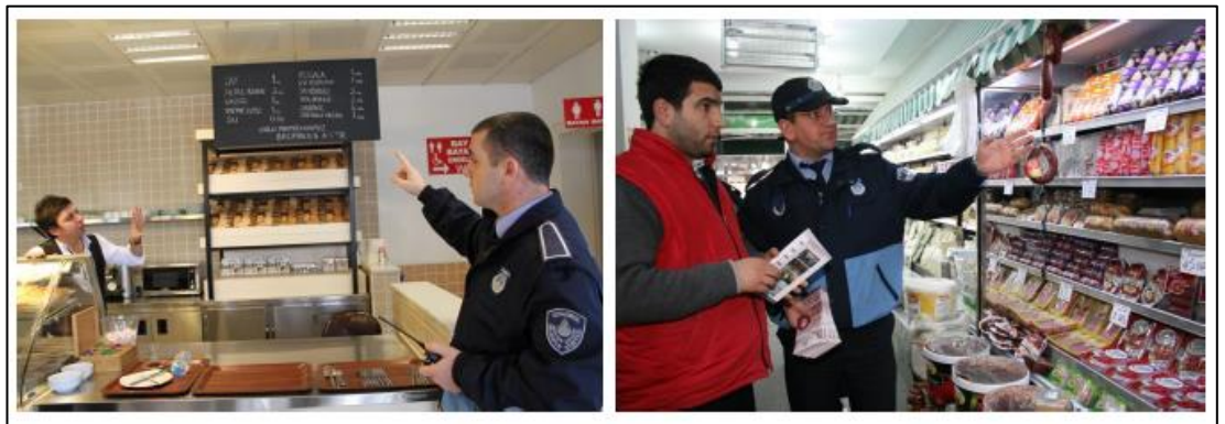
Şekil 4.5: İBB Zabıtanın Fiyat, Etiket ve Tarife Listesi Denetimleri

Kaynak: İBB Zabıta Daire Başkanlığı Faaliyet Raporu 2018