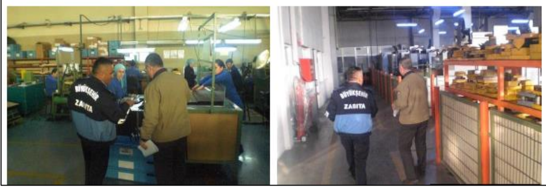
Şekil 4.7: Zabıta Ekipleri Tarafından Yapılan İşyeri Denetimleri

Gayrisihhi müesseselerin denetlenmesi, belediyelerin ruhsat veren birimlerinde çalışan teknik personel tarafından yapılmaktadır. Çünkü bu müesseseler üretim kapasiteleri, üretim türleri ve üretim yapmak için kullandıkları makine ve hammaddeleri gereği farklı uzmanlık alan bilgisi gerekmektedir. Dolayısı teknik manadaki denetimlerin konularında uzman teknik elemanlar tarafından yapılması gerekmektedir.