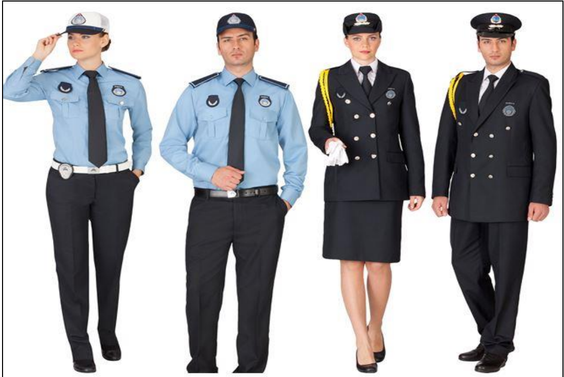
Şekil 2.4: Günümüz Belediye Zabıtası ve Üniformaları

Belediye Kanununa müteakip 2007 yılında “Belediye Zabıta Yönetmeliği” çıkarılmıştır. Zabıta teşkilatının beklentilerini karşılamasa da birçok konuda yeni düzenlemeler getirilmiştir. Zabıta memurluğuna giriş, görev, yetki, sorumluluklar, görevde yükselme esaslar gibi düzenlemeler yapılmıştır. Bu yönetmeliğin getirdiği en önemli düzenleme kılık kıyafet ve araçlardaki birlikteliktir. Artık belediye zabıtası aynı kıyafetleri giyinip aynı tip araçları kullanmaya başlamıştır.