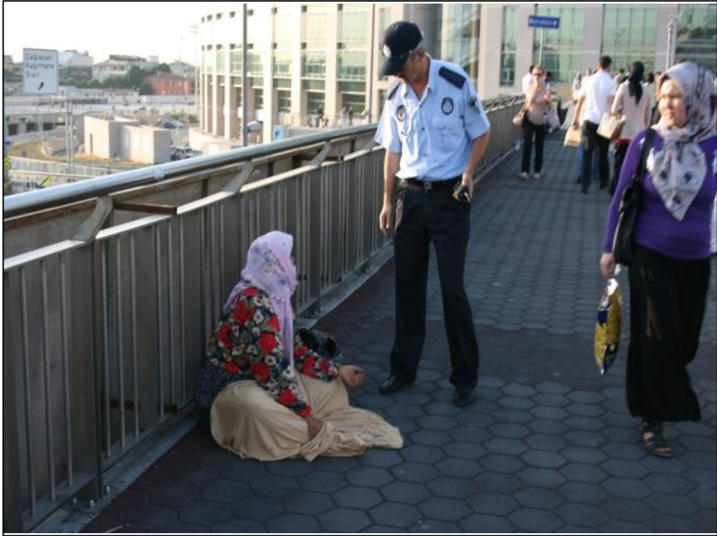
Şekil 4.1: El Açarak Dilencilik Yapan Kişiye Zabıta Müdahale Ediyor

Bir taraftan acıma, merhamet etme, iyilik yapma, sevap kazanma, kazalardan korunuma, sadaka verme gibi duygu ve inanışların yoğun olarak yaşandığı bir toplum yapımızın varlığı bir vakadır. Toplum bu yapısını sömürü haline getirmiş veya insanların vicdani ve dini duygularını sömürü aracı olarak kullanmayı keşfetmiş bir gurup veya topluğun varlığı da bir vakadır. O zaman dilencilik yapanlar ile mücadele edilirken kullanmış oldukları argümanları iyi incelemek ve bu argümanları da işin içine katarak mücadele edilmesi gerekmektedir. Dilencilik yapan kişilerin bulunduğu sosyal çevre, ekonomik imkânlar, toplumun bakış açısı gibi birçok değişken faktörün bir arada değerlendirilmesi sonucu çözüm yolları ve yöntemleri ortaya konmalıdır.