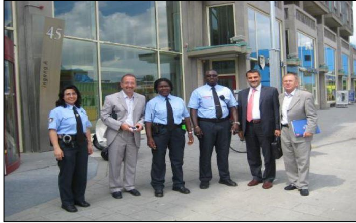
Şekil 5.1: Rotterdam Belediyesi Zabıtası (Stadtoezicht)