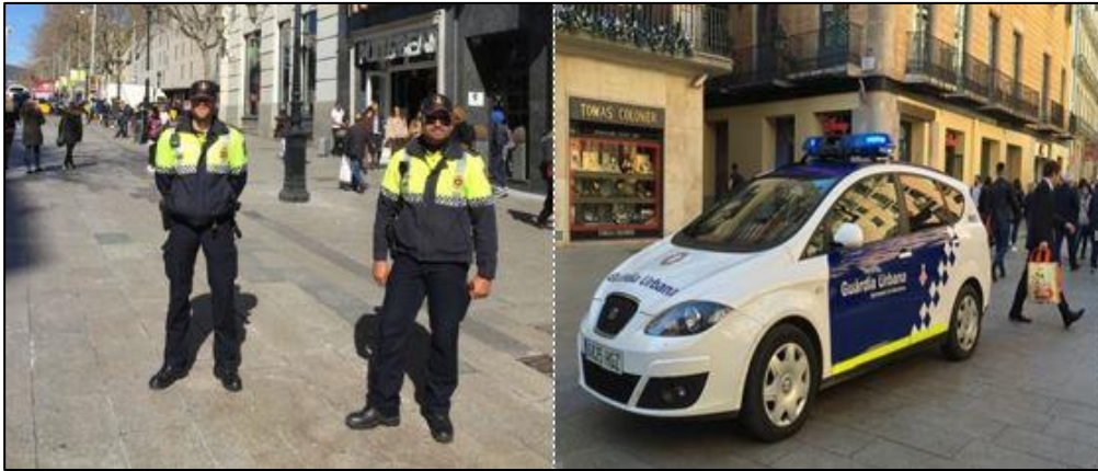
Şekil 5.8: Belediye Zabıtası (Guardiana Urbana) ve Ekip Aracı

Belediye Başkanına bağlı olarak görev yapan polis teşkilatıdır. Katalonya Polis Teşkilatı ile aynı teçhizat ile donatılmıştır. Teçhizat olarak silah, jop, kelepçe vb. unsurları kullanabilmektedir. Kimlik sorgulama yapabilmekte ve suçluları savcılığa direkt sevk edebilmektedir. İşyerlerinin açma ruhsatlarını kontrol edebilmektedir. 10 idari bölgede 10 komiserliği mevcuttur, bölgesel birimleri, atlı birlikleri, trafik denetleme birimleri bulunmaktadır. (Barselona Ziyareti 2016)