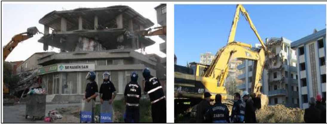
Şekil 4.6: İBB Zabıtasının İmarla İlgili Yıkım Kararlarını Uygulaması

Belediyelerin yetki alanı içinde güvenlik tedbirleri alıp gerekli gördüğü arsaların etrafını çevirerek güvenliği sağlar. Tehlike arz eden açıkta bulunan kuyu, mahzen gibi yerleri kapatarak ya da kapattırarak güvenliği sağlar. Foseptik kuyusu veya kanalizasyon çukurlarını sızıntı yapma durumuna karşı kontrol ve mani olur. Yıkılma derecesinde olan binaların boşaltılmasını sağlar ve kontrol altında tutar. Yıkımına karar verilen yapılarla ilgili gerekli tedbirleri alır. Ruhsata aykırı yapılan yapıları tespit eder ve derhal faaliyeti durdurarak yetkili elemanlarla birlikte tutanak düzenleyip ilgililer haklarında yasal işlem başlatır.