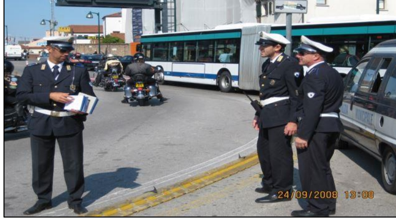
Şekil 5.4: Venedik Belediye Zabıtaları (Polizia Municipale)

Belediye Zabıtalalarının kullandığı araçlar lacivert renkte, beyaz şeritli olup tepe lambası bulunmaktadır. Tarihi Venedik kısmında genelde tekne ile ve yaya olarak görev yapılıyor. (Venedik Ziyareti 2008)