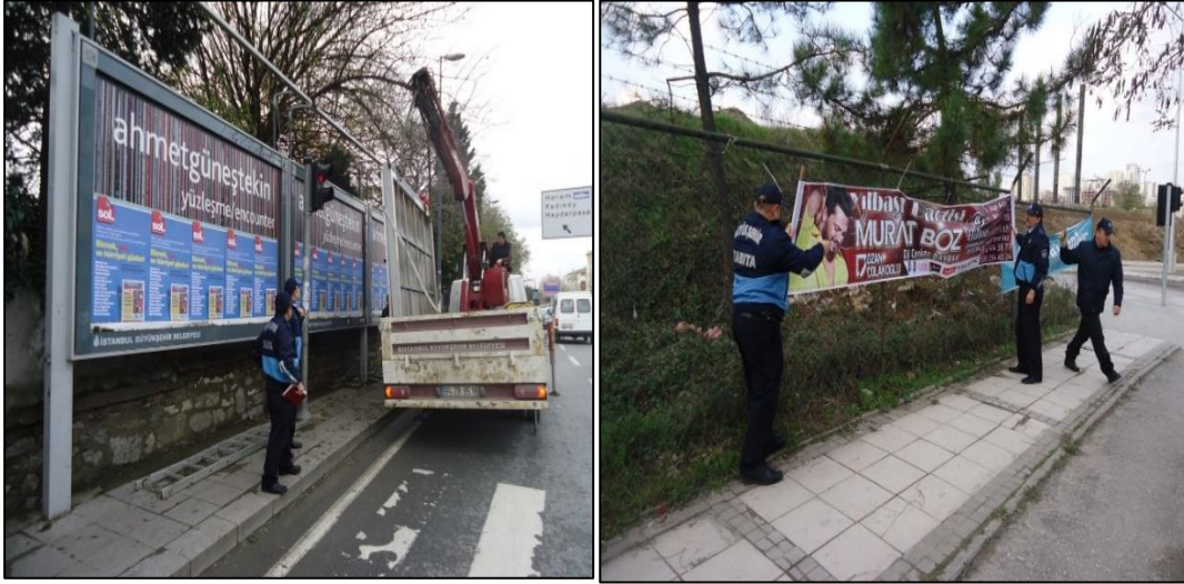
Şekil 4.4: İBB Zabıta Ekipleri Tarafından Kaldırılan İlan Reklam Unsurları

Belediye, Büyükşehir ve Belediye Gelirleri Kanunu dışında bir başka yasal düzenlemede 5326 sayılı Kabahatlara Kanununda yapıldığı görülmektedir. Kanunu'nun 42 nci maddesinin birinci fıkrası meydanlara, cadde veya sokaklardaki kamu alanlarına, izni olmadan özel mülkiyete ait alanlara her türlü uygulamayı asan kişi ya da kuruluşa, kolluk veya zabıta tarafından idari yaptırım uygulanacağı, izin alınarak asılan ilan ve reklam uygulamasında izin verilen tarih aralığının belirtilmesi ve verilen sürenin dolmasını müteakip, afişi veya ilanı asan gerçek veya tüzel kişiler tarafından derhal toplanması veya toplatılması aksi takdirde birinci maddede belirtilen yaptırımın uygulanacağı gibi kaldırılmaması durumunda yetkili birimlerce kaldırılacağı ve ortaya çıkacak masrafların ilgili kişilerden tahsil edileceği belirtilmektedir.