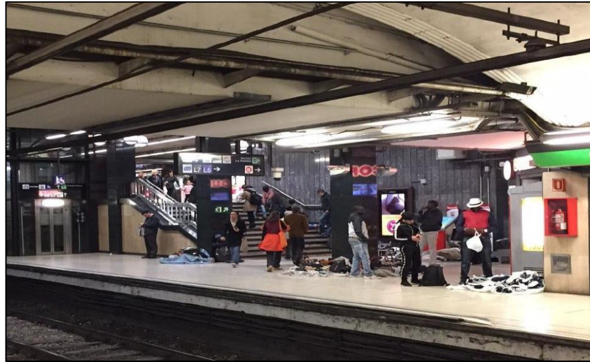
Şekil 5.9: Metro İstasyonu Seyyar İşgali