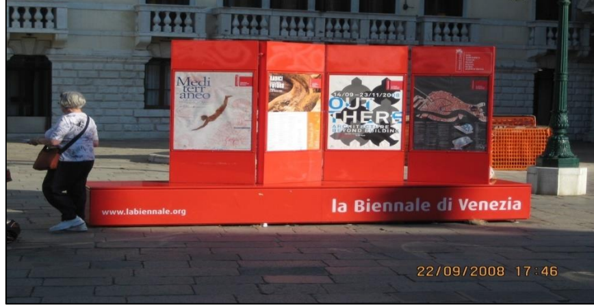
Şekil 5.7: Meydanlardaki Reklam Unsurları

Meydanlara kurulan belediyeye ait tanıtım unsurları aynı zamanda dinlenme, oturma yeri olarak kullanılabilir. (Venedik Ziyareti 2008)