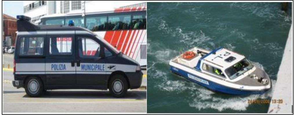
Şekil 5.5: Venedik Belediye Zabıta Ekip Araçları

Belediye Zabıtalalarının kullandığı araçlar lacivert renkte, beyaz şeritli olup tepe lambası bulunmaktadır. Tarihi Venedik kısmında genelde tekne ile ve yaya olarak görev yapılıyor. (Venedik Ziyareti 2008)