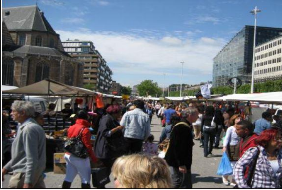
Şekil 5.3: Rotterdam Caddeye Kurulmuş Pazar