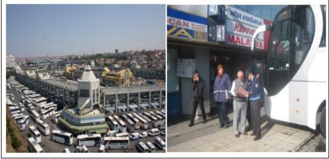
Şekil 4.11: İBB Zabıta Tarafından Terminallerde Yapılan Denetim

Karayolu Taşıma Kanunu'nun 26 ncı maddesinde belirtilen idari para cezalarını vermeye terminallerde görevli belediye zabıtası yetkilidir.