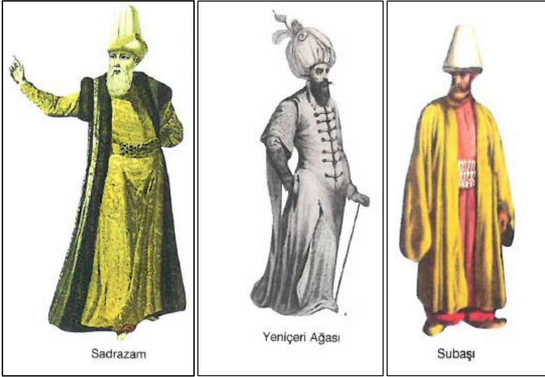
Şekil 2.1:Osmanlı Döneminde Sadrazam, Yeniçeri Ağası ve Subaşı

Kaynak: Memiş, Şefik, Belediye Zabıta Tarihi (2008:16,17)