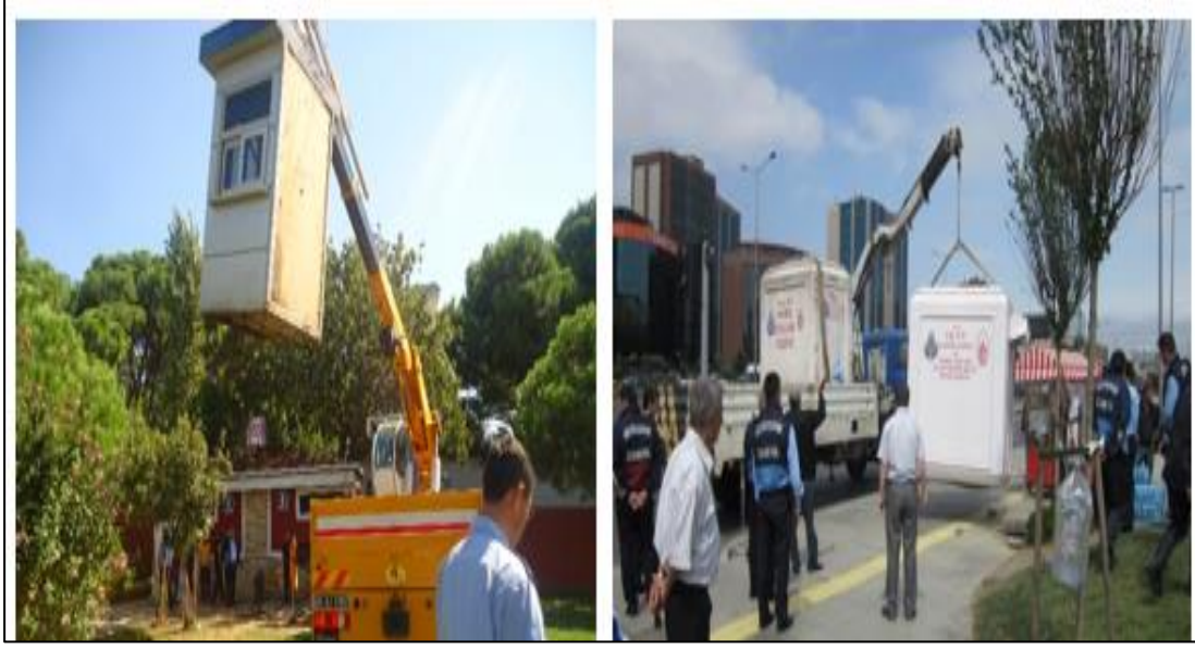
Şekil 4.3: İBB Zabitanın İzinsiz İşgaller İle İlgili Çalışmaları