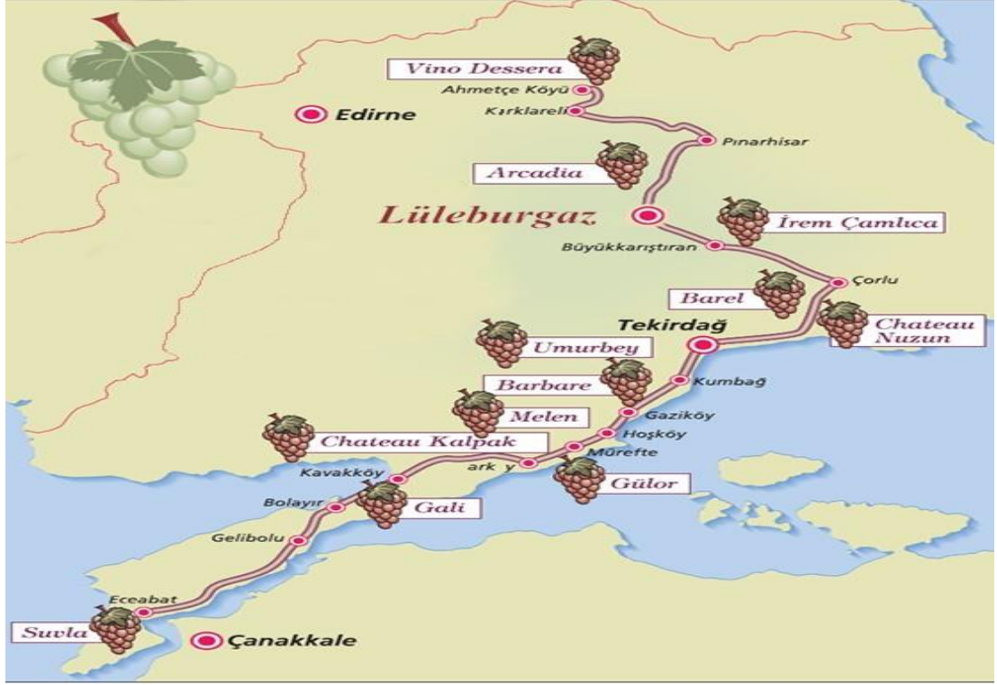
Şekil 4.3: Trakya Bağ Rotası Projesi

Bölgede ulaşım akslarının kesiştiği noktada bulunan Lüleburgaz, ulaşım ve erişilebilirliği açısından stratejik önem taşımaktadır. İstanbul ve Türkiye'yi Avrupa'ya bağlayan D-100 kara yolu kent içerisinden ve TEM otoyolu kentin 3 km kuzeyinden geçmektedir. Ayrıca Çorlu Hava Limanına yakınlığı nedeniyle uluslararası kargo taşımacılığında, Tekirdağ Limanı'na yakınlığı nedeniyle deniz yolu ulaşımından faydalanmaktadır. Kırklareli-Edirne havzasına yapılması planlanan havalimanı projesinin hayata geçmesi ile birlikte Lüleburgaz, bütün bu sistemlere eşit uzaklığı nedeniyle fırsatları içinde barındırmaktadır.