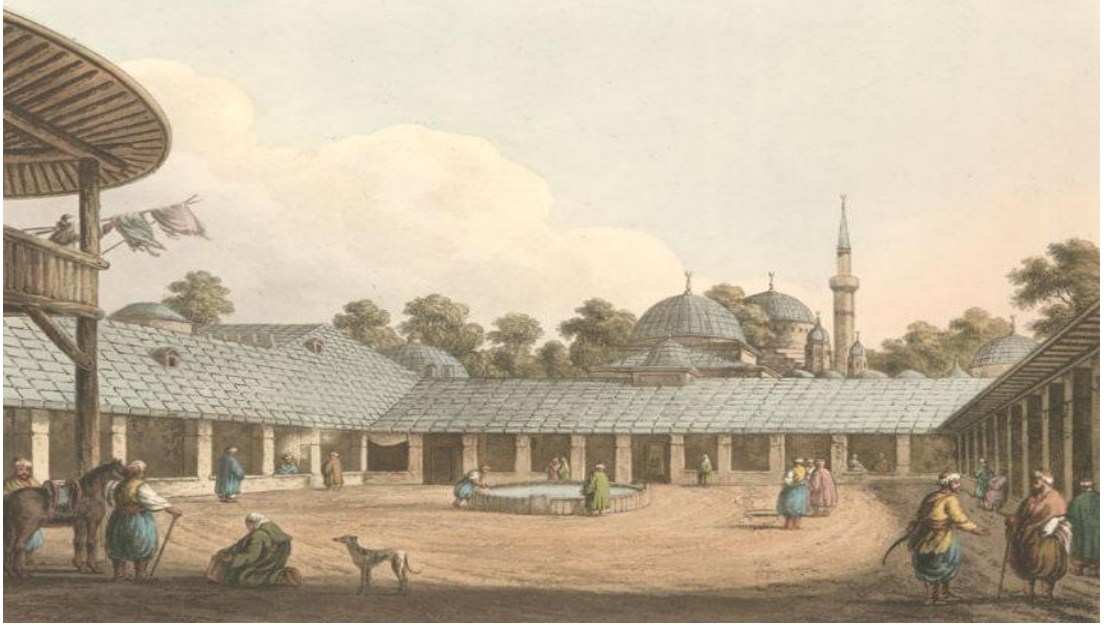
Şekil 4.4: Sokollu Mehmet Paşa Külliyesi - Kervansaray Avlusu

Kent kültürünü en çok etkileyen faktörlerin başında o kentin fiziksel, sosyal, kültürel, ekonomik ve tarihsel özellikleri gelmektedir. Tarihsel süreç analiz edildiğinde Lüleburgaz'ın tam anlamıyla "Osmanlı Kenti" kimliğine bürünmesi 16. yüzyılda Sokollu Mehmet Paşa Külliyesi ile başlamıştır. Sokollu Mehmet Paşa'nın kendi ismini taşıdığı ve birçok külliye'den daha büyük ve daha fazla fonksiyona sahip olan böyle bir yapıyı inşa etmesi ve çevre düzenlemeleri ile birlikte Lüleburgaz'ı yeniden imar ederek şehir haline getirmesi, Lüleburgaz'ın konumu ve yapısı itibari ile son derece stratejik öneme sahip olduğunu açıkça göstermektedir. Özellikle Kanuni Sultan Süleyman döneminde Balkanlar ve Avrupa'ya yapılan seferlerin artması, İstanbul-Belgrad arasındaki ulaşımı sağlayan eski Roma yolunun tekrar etkin bir biçimde kullanımını gerektirmiştir. Bu doğrultuda güzergâh üzerinde önemli merkezler, menzil adı verilen konaklama ve durak yerleri olarak belirlenmekteydi. Lüleburgaz, ordunun konaklayabileceği ve iâşesini sağlayabileceği menziller içinde en başta gelen yerleşimlerden biridir.