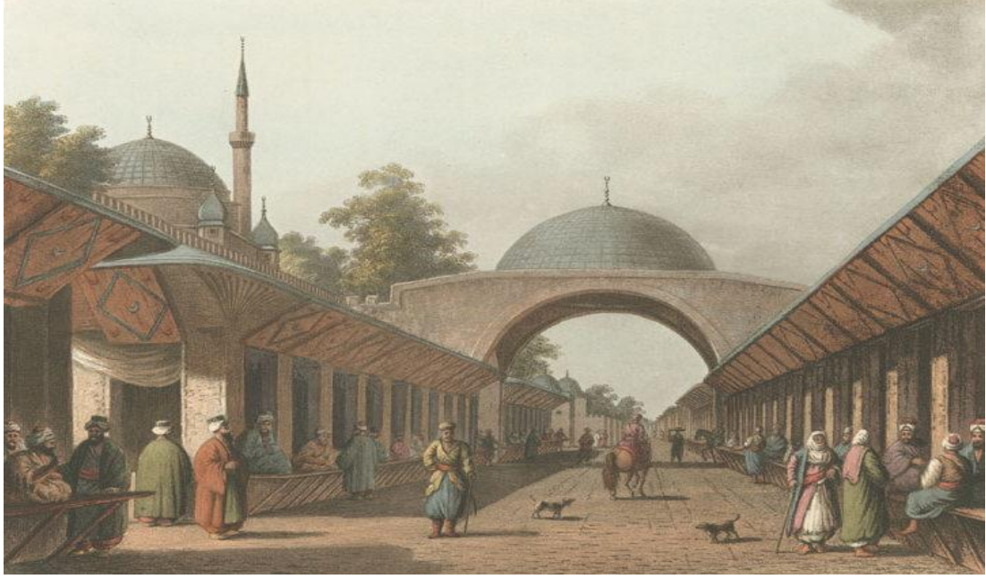
Şekil 4.5: Sokollu Mehmet Paşa Külliyesi - Arasta

hayvan, tahıl, kumaş vb. malları taşıyan kervanların konaklayabilmesi için tesislere ihtiyaç vardı. Çevresi itibari ile zengin ve verimli topraklara sahip olan Lüleburgaz'da son derece büyük bir kervansarayın ve yoğun ticari ilişkilerin gerçekleştirildiği çok sayıda dükkân ve panayırın bulunması, Lüleburgaz'ın ekonomik açıdan da kritik öneme sahip olduğunun açıkça göstergesidir.