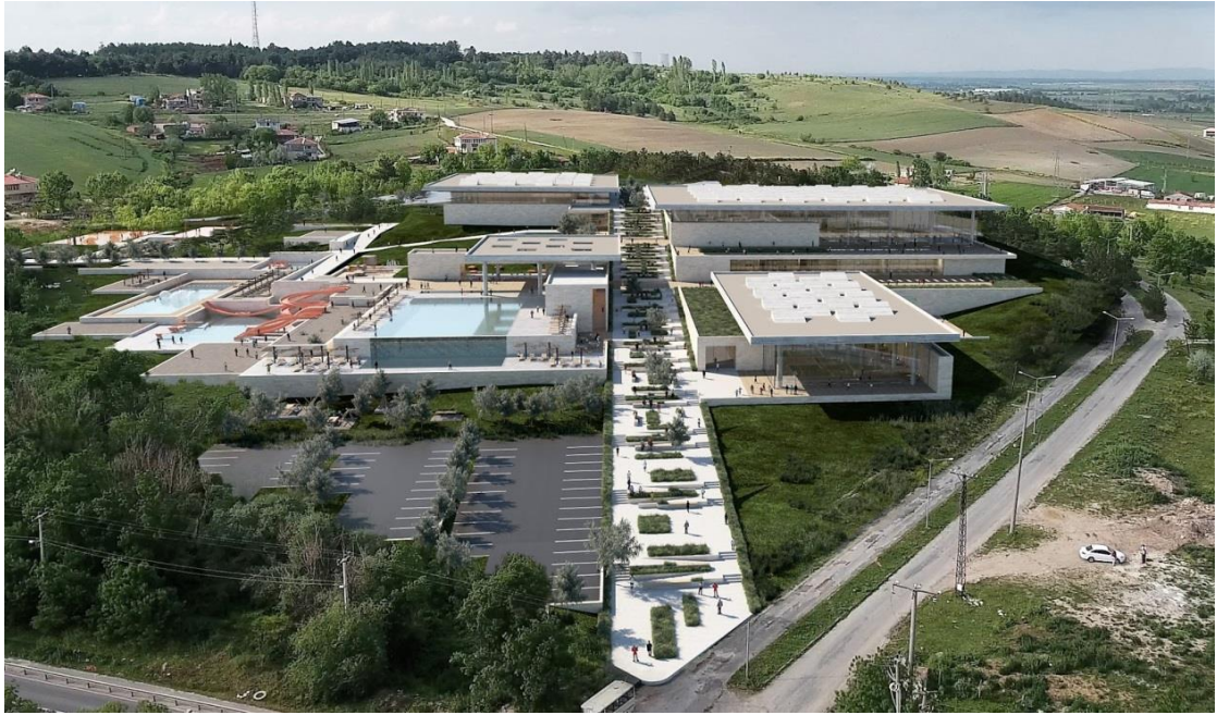
Şekil 4.11: Lüleburgaz Yıldızları Yüzme Akademisi

Nitelikli kentleşme, sosyal donatıların planlanarak kent hayatına adapte edilmesi ve bu alanlar çevresindeki sosyal hayatın zenginleşmesi ile sağlanabilir. Lüleburgaz Yüzme Akademisi, (Şekil 4.11) spor aktivitelerinin günlük hayatın bir parçası olarak eğitim ve dinlenme alanları ile iç içe planlanıp, kent hayatına adapte edilmesi amacıyla örnek bir model olarak ele alınmıştır (Gürkan, 2016).