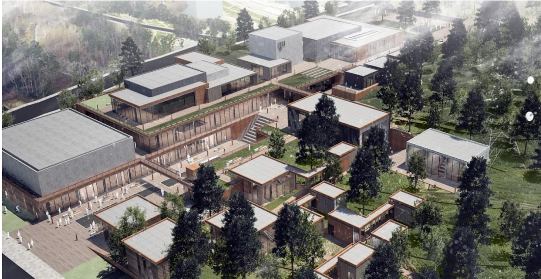
Şekil 4.7: Lüleburgaz Yıldızları Sanat Akademisi

Lüleburgaz Yıldızları Sanat Akademisi projesi (Şekil 4.7), Lüleburgaz Belediyesi'nin yaklaşık 15 yıldır çok önem vererek sürdürdüğü kent kültürü odaklı sosyal içerikli projelerinin en önemli parçalarından biri olarak inşa sürecine başlamıştır. Lüleburgaz'ın sosyal ve kültürel ihtiyacına yönelik kentlinin zenginliğini kentin zenginliği ve niteliğine yansıtmaya çalışan, bunu da kentin sosyal ve kültürel hayatının zenginleşmesinde yattığına inanan bir yönetim anlayışı ile çalışan belediye, bu sürecin kentin fiziki çevresinden ve mekânsal niteliklerinden ayrı olmadığını düşünmektedir (Dündaralp, 2015). Bu nedenle tesisin konumu kentin en önemli noktalarından birinde yer almaktadır.