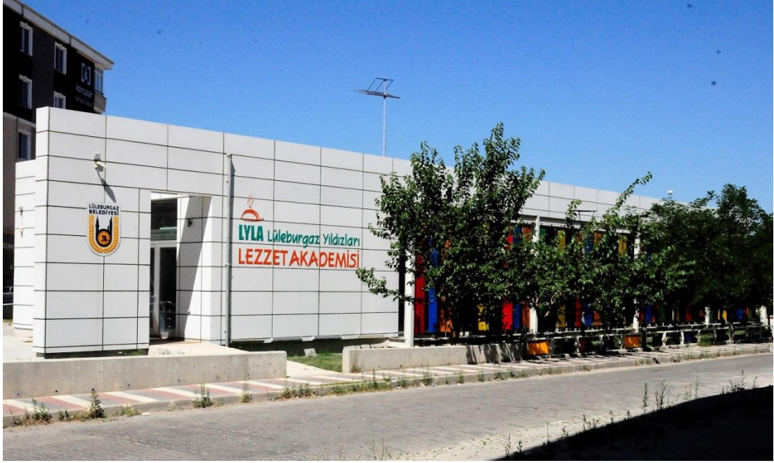
Şekil 4.10: Lüleburgaz Yıldızları Lezzet Akademisi (Lüleburgaz Belediyesi Plan ve Proje Müdürlüğü Arşivi, 2016)

Akademisi (Şekil 4.10) sayesinde geniş bir yöresel mutfağa sahip olan Trakya Bölgesi'nde doğru bir konumlandırma ve çekici bir imajla Lüleburgaz'ın gastronomi konusunda cazibe merkezi haline gelmesi hedeflenmiştir.