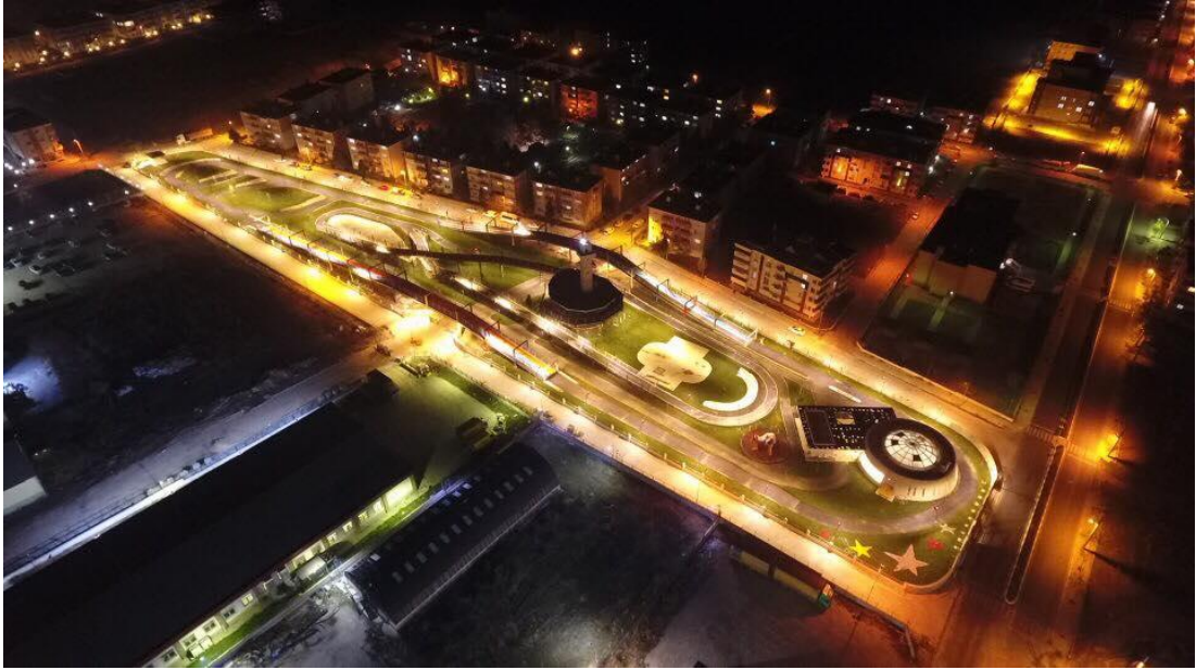
Şekil 4.9: Lüleburgaz Yıldızları Motosiklet ve Bisiklet Akademisi (Lüleburgaz Belediyesi Plan ve Proje Müdürlüğü Arşivi, 2016)

ilkesi göz önüne alınarak halkın daha temiz ve bilinçli ulaşım araçlarını tercih etmesi hedeflenmektedir (Şekil 4.9).