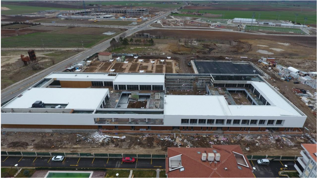
Şekil 4.8: Lüleburgaz Yıldızları Kadın Akademisi (Lüleburgaz Belediyesi Plan ve Proje Müdürlüğü Arşivi, 2016)

yararını gözeten, kentsel yaşam kalitesine katkı sağlayan, çevre tasarımları ile desteklenen açık ve yeşil alanlar, çocuk parkları ile spor alanlarını içeren, güzel sanatları teşvik eden özgün öneriler getirilmiş bir proje olan Lüleburgaz Yıldızları Kadın Akademisi (Şekil 4.8), kadınların toplumsal hayata katılımlarına, üretimlerine ve diğer ailesel problemlerinin çözülmesi ve destek olunmasına yönelik bir yapıdır. Ağırlıklı olarak çocuk ve kadınların uzmanlarla iletişim kurarak gelişim ve üretim anlamında etkinliklere katılabilecekleri, çeşitli kongre ve seminerlere halkın da katılımıyla birlikte çözümler üreteceği bir akademi olarak düşünülmüştür.