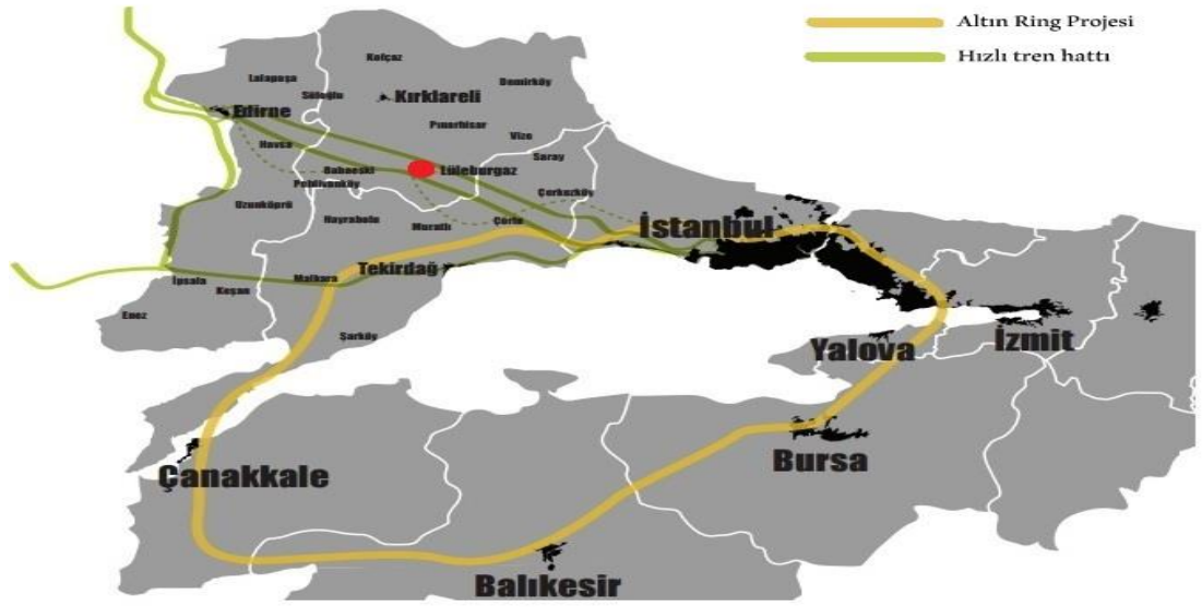
Şekil 4.2: Hızlı Tren Hattı ve Altın Ring Projesi (Trakya Kalkınma Ajansı Lüleburgaz Vizyon Planı)

İstanbul'daki sanayinin desantralize edilmesinden sonra en başta Kocaeli ve Bursa olmak üzere çevre yerleşimler son derece olumsuz etkilenmişlerdir. Ticari kapasitenin ve hizmetlerin desantralize edilmesi sürecinde Yeşil Bursa'nın yeşilliğinden eser kalmamışken Kocaeli'de yaşanan çarpık kentleşme ciddi boyutlara ulaşmıştır. Bu gelişmeler göz önünde bulundurulduğunda Lüleburgaz, İstanbul'un dinamikleri sebebiyle hızlı bir değişim ve dönüşüm sürecine hazırlanmaktadır. Lüleburgaz'ın merkezinden geçerek Avrupa'ya uzanması planlanan hızlı tren hattının ve Marmara denizinin etrafını çevreleyecek olan altın ring projesinin (Şekil 4.2) bu süreci hızlandıracağı beklenmektedir.