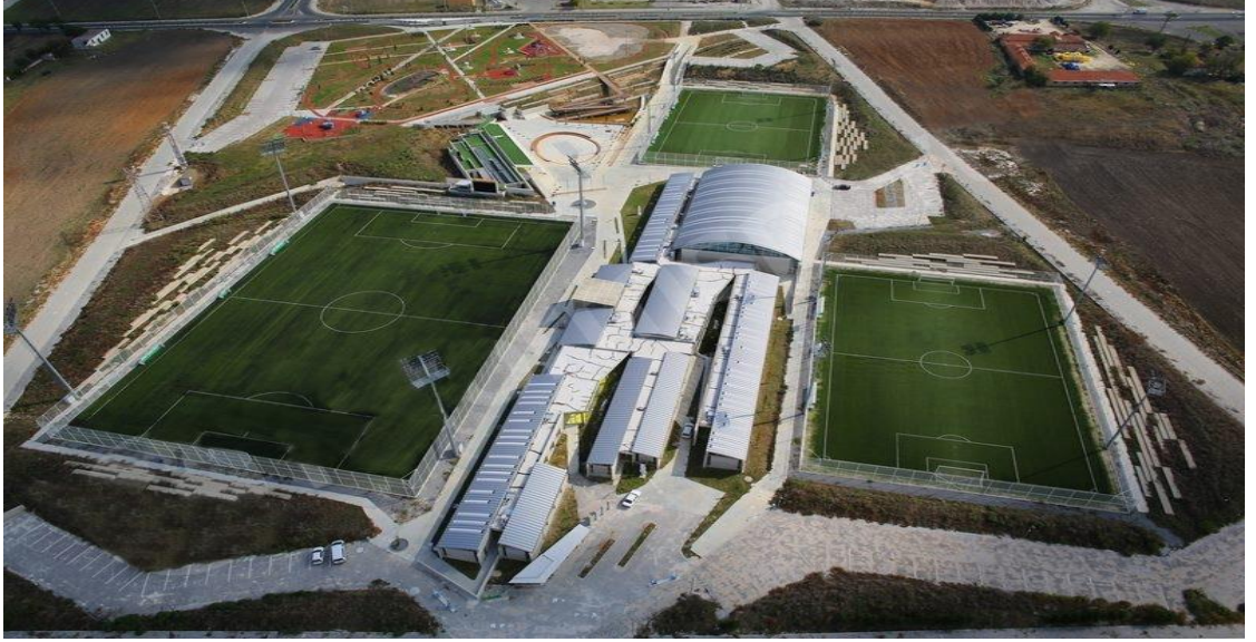
Şekil 4.6: Lüleburgaz Yıldızları Futbol Akademisi

tasarlanmıştır. Tüm bu alanlar, hem engelli kullanımlarına izin veren hem de bisikletle dolaşıma izin veren rampalı dolaşım alanları ile birbirine bağlanmıştır. Kentin merkezindeki kentsel dokunun sıkışık ve talepleri karşılayamayan fiziki çevresinin potansiyellerini dönüştürmeyi hedefleyen, yeni odak noktaları ve dinamikler oluşturarak hem kentsel dokuyu rahatlatmaya hem de kentliye yeni olanaklar yaratmaya çalışan çalışmaların bir parçasıdır (Dündaralp, 2011).