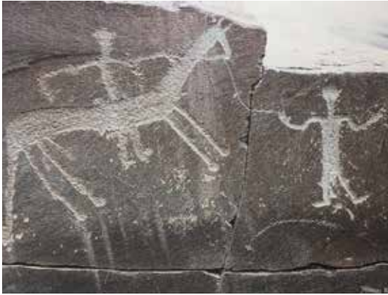
Resim 10. At ve İnsan Figürü Tasvirleri, (Somuncuoğlu, 2008: 385).

bu amaçla gök cisimlerdeki olayları ve hareketleri inceleyerek 12 hayvanlı Türk takvimi adını verdikleri bir zaman ölçer aracı üretmişlerdir. 12 yıla bir hayvan ismi verdikleri bu takvimde bir yılın adının "at" oluşu ona atfettikleri değerlerin bir diğer göstergesi olarak karşımıza çıkmaktadır.