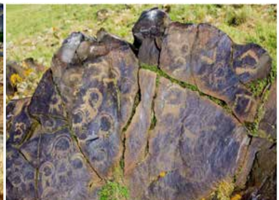
Resim 2.-3. Saymalı Taş Dağ Keçisi Figürleri, ( http://www.antiktarih.com / Erişim: 06.07.2019).