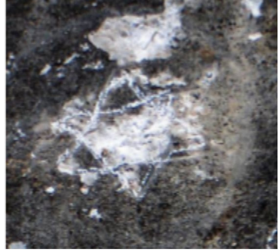
Resim 6.-7. Dilli Vadisinde Güneş ve Yıldız Tasvirleri, (Mert, 2007: 248).