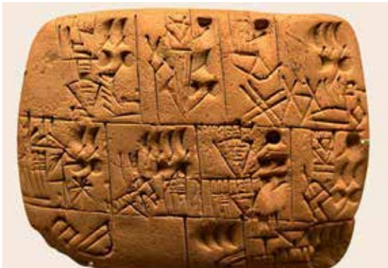
Resim 1. Çivi yazısı tableti

Tüm ifade biçimlerinde olduğu gibi, kayalar üzerine yapılan resimler de değişen ve gelişen toplumsal yaşam ve çağa bağılı olarak gelişim süreci içerisinde önemli değişimler göstermiştir. Türk inaniş ve yaşayışla şekil