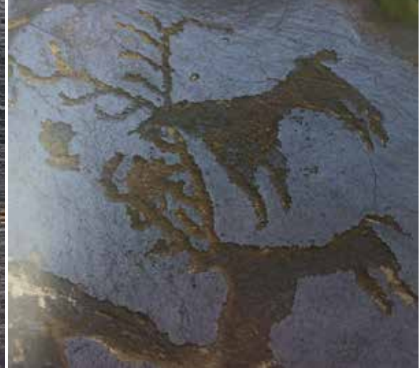
Resim 8-9. Geyik Tasvirleri, (Somuncuoğlu, 2008: 353).

bağ vardır (Mert, 2007: 245- 246). Türklerin tarih boyunca ata çok önem verdikleri yapılan araştırmalar sonucu elde edilen belgelerle bilinmektedir. Bugünkü Türk lehçelerinde at; yıldı, cıldı, çıldı şeklinde kullanıma sahiptir. "Yıldı" ve "at" adları Orhun ve Yenisey Kitabeleri'nde de kullanılmıştır. Bütün Asya, Avrupa ve Afrika kıtalarına atı tanıtan milletin Türkler olmasına karşın atın ilk ehlileştirildiği bölge tartışma konusudur. Hunlar at besleyerek ekonomilerinin büyük bir oranının ona ayırmışlardır. Hunların Çin'e