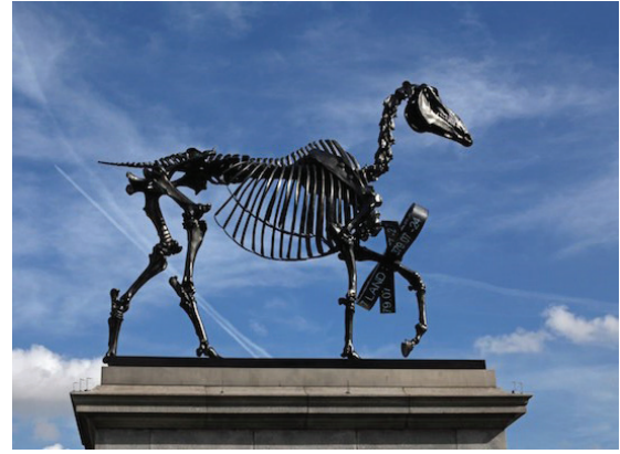
Resim 4: Hans Haacke, 'Hediye At'

"19. yüzyılın sonlarında anıt mantığının zayıflayışına tanık olduk. Ama akla, her ikisi de kendi geçiş statülerinin izlerini taşıyan iki örnek geliyor. Rodin'in "Cehennem Kapıları" ve "Balzac" adlı heykelleri anıt olarak tasarlanmıştır. İlki 1880 yılında yapılması planlanan bir dekoratif sanatlar müzesinin giriş kapısına yerleştirilmek üzere; ikincisi ise 1891 yılında, edebiyat dehasının anısına Paris'te belli bir yere dikilmek üzere sipariş edilmişti. Çeşitli ülkelerdeki çeşitli müzelerde