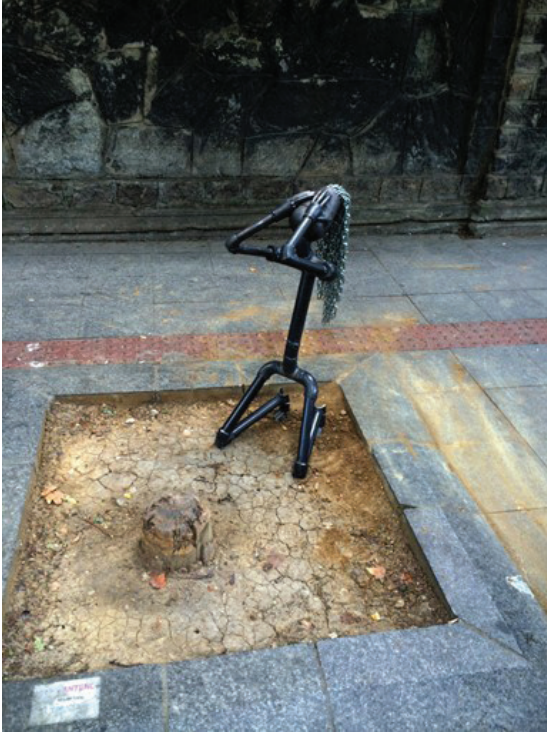
Resim 8: İskender Giray, 'Ağaca Ağıt'

Bu bağlamda gerilla heykeli kamusal alanda bir alternatif olarak değerlendirebiliriz. Sanat piyasasının her şeyi belirlediği ve başka bir seçenek yok dediği günümüzde başka bir seçeneğin mümkün olduğunu söyleyebiliriz. Avan-gard Sanattan beri piyasayla bir mücadeleye girilmiş, sanatın metalaştırılmaması için her şey denenmiştir. Occupy Museums eylemleri müzelerin sanattan çok parayla ilgilendiğini ve küresel şirketlerle nasıl ilişkileri olduğunu gözler önüne sermiştir. Türkiye'de ise yeni yapılacak olan müzelerden bahsedilirken ve müzelerle ilgili kimsenin kesin bir şey söyleyemediği şu dönem kamusal alan daha bir anlamlı hale gelmiştir.