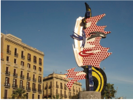
Resim 3: Roy Lichtenstein, 'El Cap de Barcelona'

"Yeni caddeler, kırsallarla, işçi mahalleleri arasında ki en kısa yolu oluşturacaktır"(Benjamin, 2017: 102).