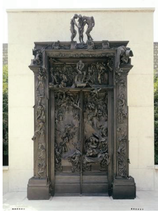
Resim 2: Auguste Rodin, 'Cehennimin Kapıları'

Kamusal alan 18.yüzyılda dillendirilmeye başlanmış ve özgürlükçü bir burjuva alanı olarak ortaya çıkmıştır. İngilizce'de public (kamu), public space (kamusal alan) olarak geçen "kamusal alan", kavramı sokakları, caddeleri, meydanları ve parkları kapsamaktadır. Anlam olarak ise kamu, halk kelimesine karşılık gelmektedir. Genelde heykellerle beraber var olmakta ve kentin ruhunu yansıtan kamusal alanı, sadece biçimsel olarak ele almaktansa kavramsal boyutuyla demokrasi ve özgürlük alanı olarak da düşünmek daha açıklayıcı olabilmektedir. Barok dönemde başlayan heykel-kamusal alan ilişkisi zamanla değişime uğrasa da halen devam