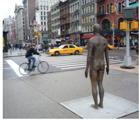
Resim 7: Antony Gormley, 'Olay Ufku'

1990'lı yılların sonundan beri küreselleşmeye karşı kamusal alanda eylemler olmuş; Seattle'dan Cenova'ya, Occupy Wall Street'den