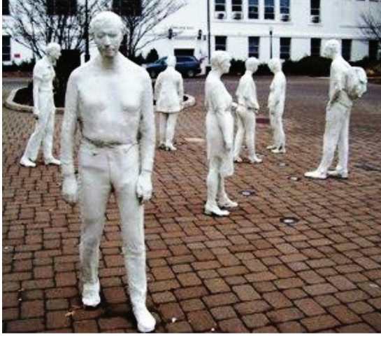
Resim 6: George Segal, 'Street Crossing'

mücadele farklı bir biçimde Gerilla Sanatla devam etmektedir diyebiliriz. Yves Klein'in bomboş galeriyle açmış olduğu sergi, Jean Tinguely'in kendini imha eden heykelleri örnek olarak gösterilebilir.