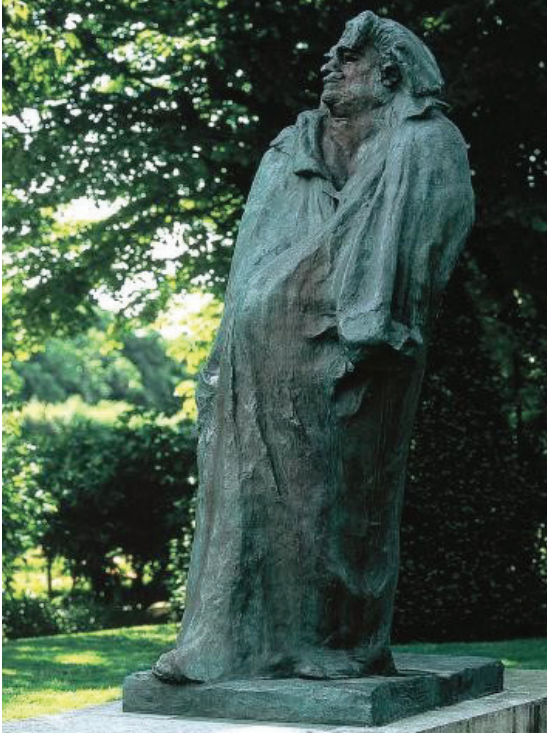
Resim 1: Auguste Rodin, 'Balzac Anıtı'