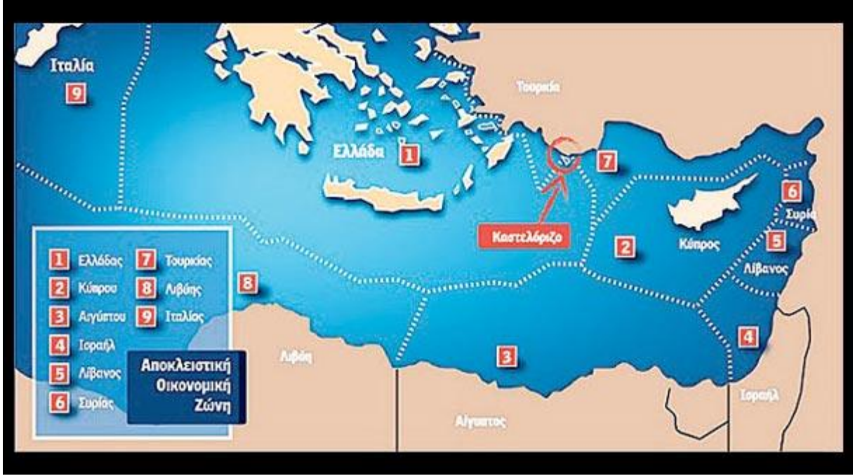
Şekil 2: Yunan Basınında Yer Alan MEB Bölgeleri