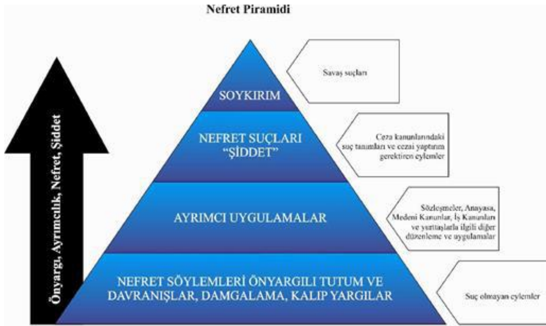
Şekil 1. Nefret Piramidi