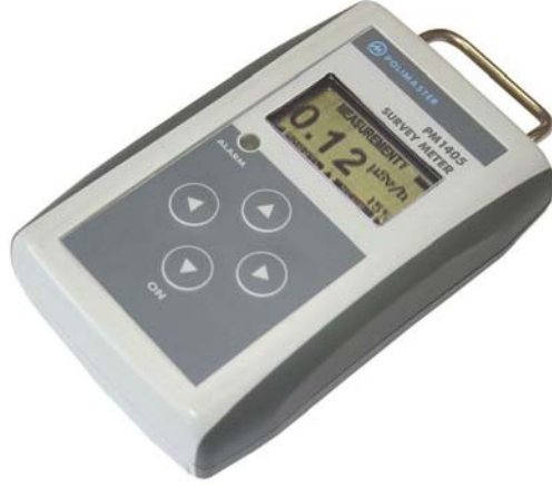
Şekil 1. Polimaster Survey Meter PM1405 detektörü