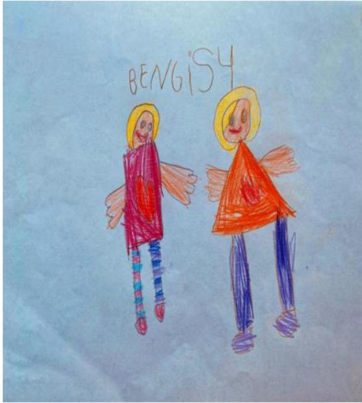
Arkadaşım ve beni çizdim. Bunlar kalplerimiz. Arkadaşlarımla burada oyun oynadığım için mutluyum. Ben mutlu olunca arkadaşlarımla hiç kavga etmiyorum. (ÇK1)

Kız çocuklarından bazıları (n=3) “değer” teması bağlamında “sevgi” unsuruna yer vermiş olup, bunu kalp olarak ifade etmişlerdir. Çocuklardan bazılarının ifadeleri şu şekildedir: