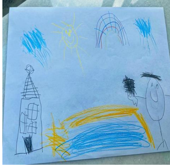
Kum, deniz, yağmur, güneş, gökkuşağı, çocuk, ev, telefon. Bu çocuk denize girdiği için mutlu. (ÇKE3)

Kız çocuklarından bazıları (n=3) “değer” teması bağlamında “sevgi” unsuruna yer vermiş olup, bunu kalp olarak ifade etmişlerdir. Çocuklardan bazılarının ifadeleri şu şekildedir: