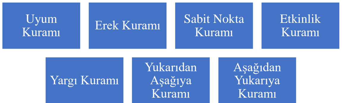
Şekil 1 Mutluluk Kuramları