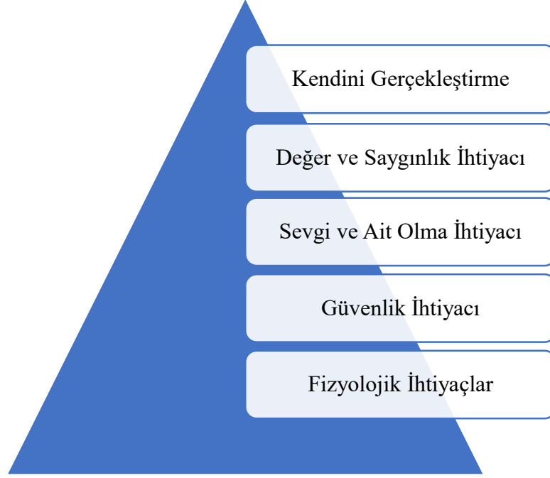
Şekil 2 İhtiyaçlar Piramidi

almaktadır. Dördüncü basamak ise başarı, özgüven, prestij gibi değer ve saygınlık ihtiyaçlarını kapsamaktadır. Piramidin nihai basamağı olan kendini gerçekleştirme ise yaratıcılık, problem çözme, bağımsız olma, otantik davranma gibi özellikleri içerir. Kendini gerçekleştiren kişiler hayattan doyum alan ve mutlu olan kişiler olduğu düşünülmektedir (Maslow, 1943).