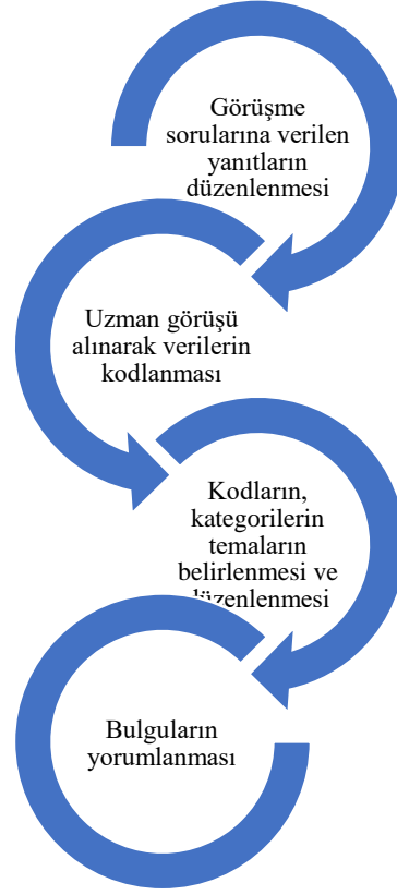
Şekil 5 Araştırmanın Veri Analizi

Verilerin analizinde katılımcıların gerçek isimleri gizlilik ilkesi kapsamında belirtilmemiştir. Katılımcı erkek çocuklar “ÇE”, katılımcı kız çocukları “ÇK” ve ebeveynler ise “E” olarak kodlanmıştır. Her katılımcıya bu kodlara göre numaralar verilmiştir. ÇE1, ÇE2, ÇE3...; ÇK1, ÇK2, ÇK3...; E1, E2, E3... şeklinde kodlamalar yapılmıştır.