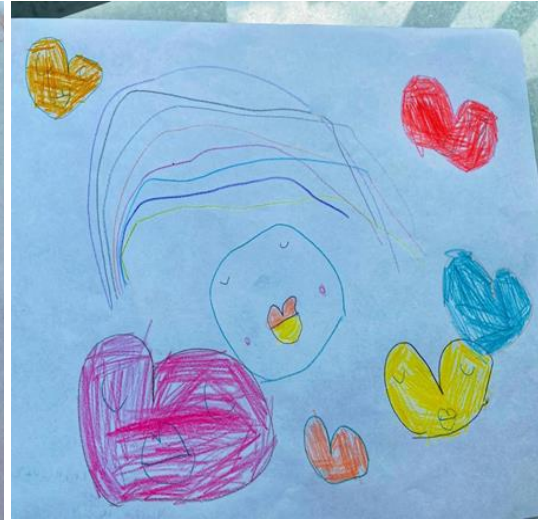
Kalpler, uyuyan bebek, gökkuşağı. Burada bebeği babası güzel bir götürüyor. Sonra yoruluyor ve mışıl mışıl uyuyor. Köye gittiğim zaman babamla mutlu olduğum için köyü sevdim ama biraz annem için ağladım. Annem köyde değildi. (ÇK8)