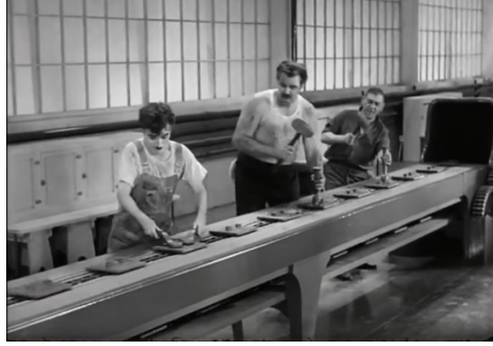
Şekil 5. Modern Zamanlar: 'Ceketini al. Grevdeyiz.'

Aslen Türkiye doğumlu olan Elia Kazan'ın 1954 yılı Amerikan yapımı Oscar ödüllü filmi 'Rihtımlar Üzerinde' de işçi sınıfı mücadelesini ele alan başyapıtlardan birisidir. Aynı şekilde, 1971 İngiliz yapımı, Yönetmenliğini Elio Petri'nin yaptığı 'İşçi Sınıfı Cennete Gider' filmi işçi sınıfı sineması kategorisinde önemli örneklerdendir. Bir diğer işçi sınıfları sineması için önemli İngiliz Yönetmen ise Ken Loach'tur. 'İşçi sınıfının yönetmeni' olarak da geçen Ken Loach, 'Ayak Takımı' (1991), 'Emek ve Güller' (2000), 'Emekçiler' (2001), 'İşte Özgür Dünya' (2007) gibi filmleri işçi sınıfını yaşamından ve sınıfsal mücadele süreçlerinden kesitler sunmaktadır.