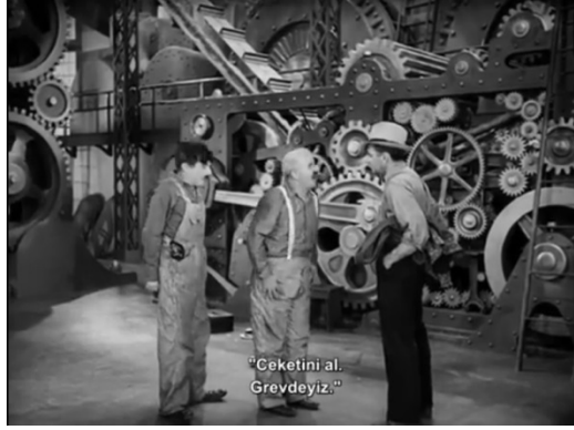
Şekil 4. Charlie Chaplin 'Modern Zamanlar'

Amerikan yapımı oyuncu ve yönetmen Charlie Chaplin'in 'Modern Zamanlar' adlı 1936 yapımı filmi de unutulmaz işçi sınıfı filmleri arasında yer almaktadır. Film dünyada çok büyük ses getirmiş, işçi sınıfının endüstriyel emek sürecindeki yabancılaşması nükteli bir şekilde aktarılmıştır. Açılış sahnesinde 'Modern zamanlar endüstri ve bireysel teşebbüsün hikayesidir. İnsanlar mutluluğu bulmanın mücadelesini veriyor.' ifadeleri ile başlamaktadır. Chaplin, filmde yönetmenlik senaristlik ve oyunculuğu üstlenmektedir. Basken elektro çelik fabrikasında somon sıkma görevli işçiyi canlandıran Chaplin, kart okuma sistemlerinden tutun da lavaboya yerleştirilmiş dev kameraya, işçilerin öğle molasını engelleyecek yeni icatlar ile çalışırken yemek yemelerini sağlayacak teknolojilere kadar işçi sınıfı denetiminin boyutlarını eleştirmektedir. Çalışma koşullarını da gözler önüne seren Fordist üretim modelinin oluşturduğu bant sisteminde çalışan işçiler, zamanla yarışarak akan bandın üzerindeki parçaları işlemeye çalışırlar. Fordizm kısaca standartlaştırılmış üretim ağının akan bir bant üzerinde ilerlemesi ile gerçekleştirilen endüstriyel üretimde hızın artması emeğin standardize edilmesini kapsayan genellikle yapılan iş için fazla bir bilgi birikimi gerektirmeyen iş disiplini ve rejiminin genel adıdır. Fordizm yabancılaştırma ve vasıfsızlaştırmayı beraberinde getirmektedir.