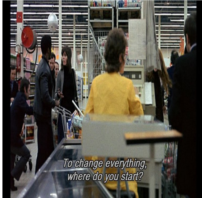
Şekil 16. Tout va Bien Süpermarket Sahnesi

Grev işsizlik ve geçim koşullarının değişmesi ekonomik temelli sorunları beraberinde getirmiş ve bu sorunlar işçi kadınlar perspektifinden de aktarılmıştır. Çark filminde hayatlarını ikame edecek karınlarını doyuracak kadar maaşa razı gelen işçiler yeter ki işsiz kalmayalım mantığının kötü koşullarda da olsa çalışmayı kabul ederken Made in Dagenham filmin kadınlar sendikasının yolladığı grev harcını bölüşmüş geçinmeye çalışmışlardır. Made in Dagenham filminde Rita karakterinin evindeki buzdolabına çalışmadıkları sürede el konulmuş Çark filminde ise sofrada sadece çorba olan sahnelere yer verilmiştir.