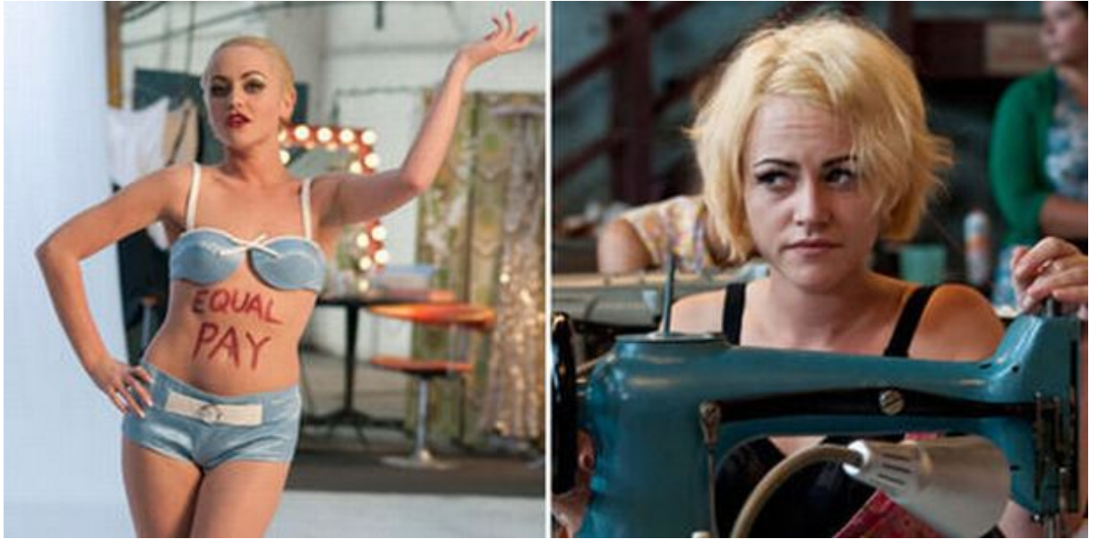
Şekil 15. Made in Dagenham Kadın İşçi Manken Sahnesi

Medyanın toplumsal gündemi aktaran haber yapma ve halkı bilinçlendirme işlevi Tout Va Bien filminde birkaç sahnede verilir ancak karakterin işçilerle yaptığı röportajının sansürlenmesi medyada hangi habere ne kadar yer verileceği ile ilgili ideolojik bir tutum sergilemektedir. Made In Dagenham filminde ise kadınların eylemi ile medya yakından ilgilenmekte durum hem magazinsel hem de haber niteliği taşımaktadır. Çark filminde işçi sınıfı eylemliliği ve hak arayışları medyaya yansımamış bunun yerine medyanın haber yapma işlevinin işçi sınıfını kapsamadığı bir noktada görünmez olduklarını niteler durumda aktarılmıştır.