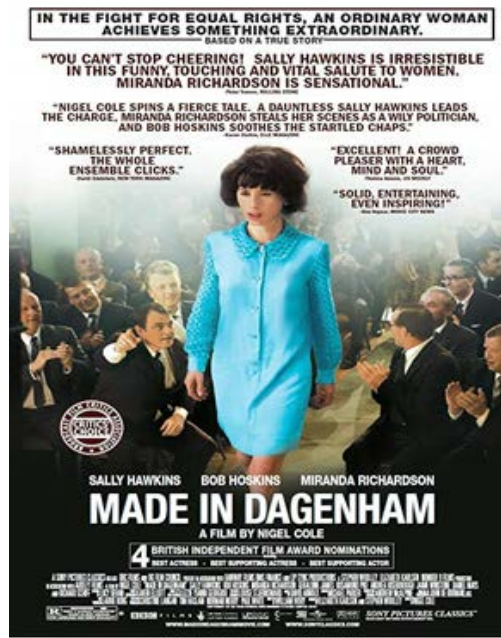
Şekil 8. Made in Dagenham (2010)