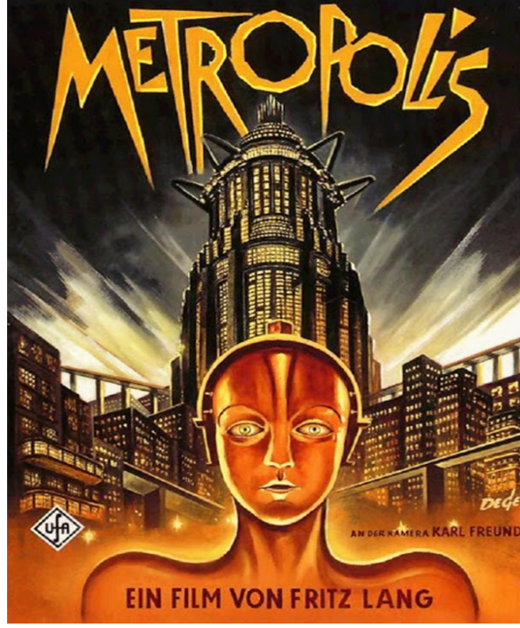
Şekil 3. Metropolis Filmi

sinemanın kendileri için sanatların en önemlisi olduğunu dile getirmiştir (Mahony, akt. Odabaşı,2021:205-208).