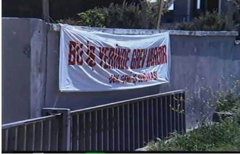
Şekil 11. 'Bu iş yerinde grev vardır' yazılı pankart

grev vardır. Patronun oyununa gelmeyin bugün bize yapılan yarın size de yapılır” sözleri ile öğrenilir. ‘Grev kırıcı’ olarak adlandırılan Rauf ve arkadaşları durumdan habersizdir. Rauf’un “bu iş yerinde grev varmış niye, söylemiyorsunuz?” cümleleri ile onları kamyonla işyerine getiren ustabaşlarına tepki gösterir bunun üzerine Ustabaşı “İsteyen çalışır isteyen çalışmaz. Şimdiki yasalar böyle artık, her şey özgürce” der. Değişen düzeni açıklayan bu sözler ustabaşı için önemli olanın işin devam etmesi olduğu görülmektedir.