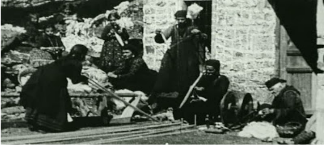
Şekil 2. Yün Eğiren Kadınlar Filmi

Tarihin ilk sinema filmi ise 1895 yılında ‘La Ciotat’, tren garında oyuncuların yolcular olduğu “Trenin La Ciotat Garına Gelişi” adlı filmi. Birkaç farklı filmin de içinde bulunduğu filmlerin halka açık gösterimi 28 Aralık 1895’te Grand Cafe’de yapıldı. O filmlerin arasında fotoğraf malzemeleri fabrikasından çıkan 100 küsur işçinin işten çıkış anları, 45 saniye boyunca ekrana yansıtıldı. ‘Lumiere Fabrikasından Çıkan İşçiler’ adlı film tarihin ilk filmleri arasında yer alan işçi görüntüleridir. Ne ilginçtir ki benzer tarihlerde Osmanlı İmparatorluğu'nda filmciliğin ve fotoğrafçılığın gelişimine önemli katkıları bulunan Milton ve Yanaki namıdiğer Manaki Kardeşlerdir. 1905 Yılında günümüzde Yunanistan'da yer alan Avdella'daki kadınların ip eğiren hallerini 1 dakika boyunca yansıtarak Balkanların ilk sinema filmini çekmişlerdir. Burada Lumière kardeşlerle bir diğerk benzerlikleri ise bu ilk filmde işçi ve işçi emeğini beyaz perdeye taşımasıdır. Bazı kaynaklarda bu ilk filmin adı ‘ev işleri’ diye de geçmektedir.