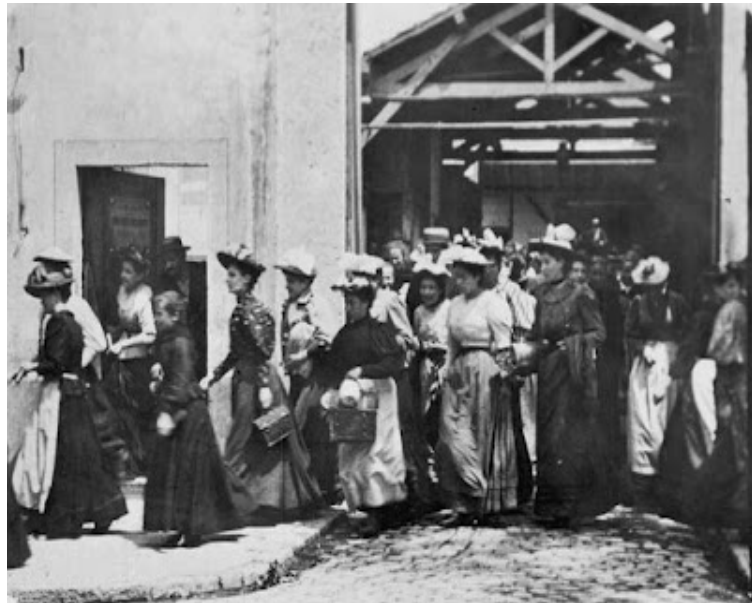
Şekil 1. Lumiel Kardeşlerin İlk Filmi

13 Şubat 1895’te La Sortie des Usines ’te, Lumière kardeşlerin tasarlayıp patentini aldığı bu yeni aygıt bugünün sinema tarihini başlatan ilk olaydır. Temel mekanizması ve mantığı Thomas Edison’un 1891 yılında geliştirdiği kinematoskopla benzerdir ancak tek kişilik bir izleme değil birçok kişiye aynı anda ulaşabiliyor olması esasen en önemli özelliğidir.