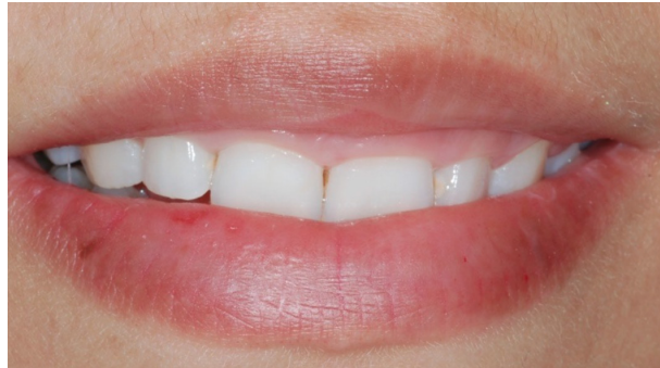
Resim 2. Tip1 gecikmiş pasif sürme olgusu. Dişlerde kare görüntü, iltihap olmamasına karşın diş eti kenarında kalınlaşma bu tür olgularda tipik klinik bulgudur.

Yüksek gülme hattının en sık karşılaşılan nedenleri arasında gecikmiş pasif sürme değerlendirilmelidir. Aktif sürme tamamlandıktan sonra diş eti kenarı apikale doğru yer değiştirir ve mine sement sınırından 1 mm kuralde veya tam sınır üzerinde nihai konumuna yerleşir 4 . Bazı bireylerde aktif sürmenin tamamlanmasına karşın diş eti kenarının bu apikale doğru migrasyonu gerçekleşmez. Sonuç olarak bu bireylerde dişetlerinin fazla görünmesi estetik soruna yol açar (Resim 2).