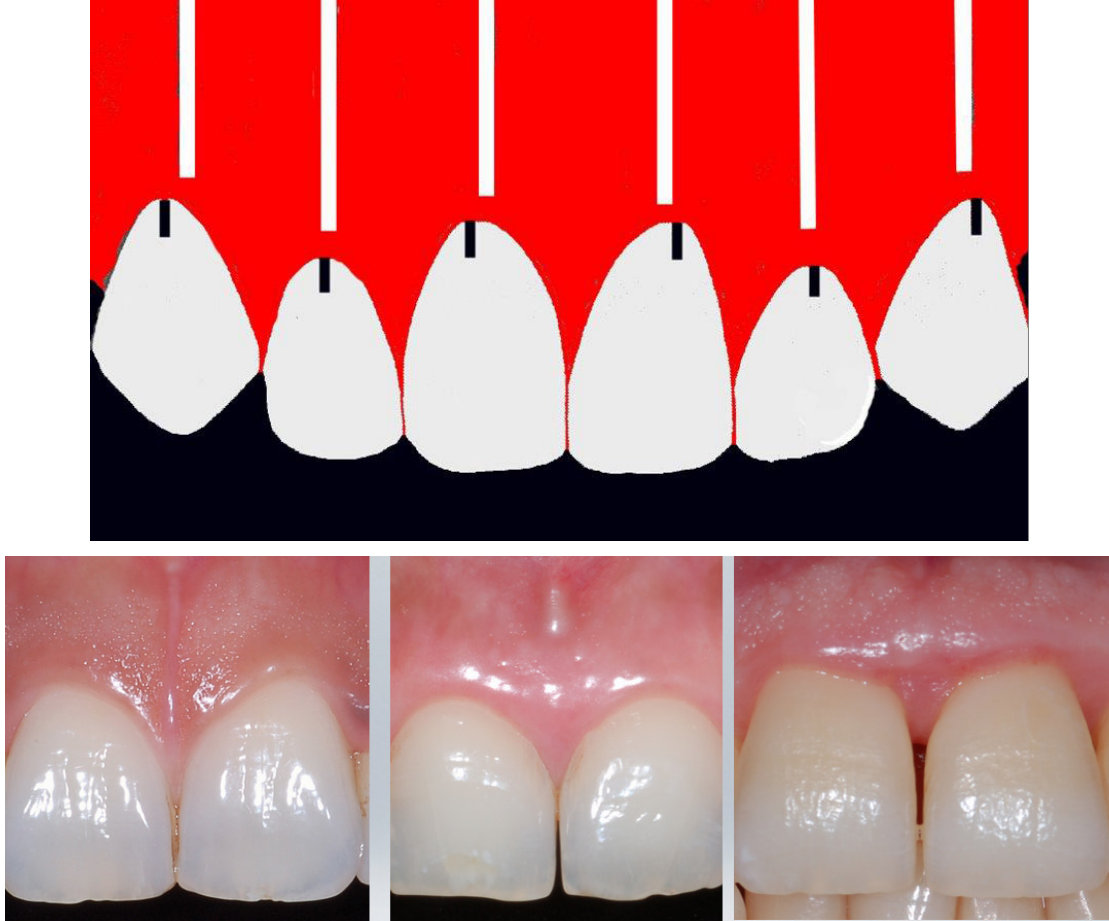
Resim 1. Klinik kuronun en tepe noktasına Zenith noktası denilmektedir. Şekilde siyah çizgi ile işaretlenen bu noktalar orta keser dişlerde ve kaninlerde klinik kuronun orta noktasına denk gelmemekte, sadece yan keser dişlerde her iki nokta çakışmaktadır.

daha fazla önem kazanmaktadır. Diş eti kenarı biyotipine bağlı olarak derin kavisler çizebilir veya daha ziyade düz bir çizgiyi andırabilir. Diş etinin biyotipi doku kalınlığının ölçülmesi ile belirlenir ve ince, normal, kalın olmak üzere alt gruplara ayrılır (Resim 1). Diş etinin biyotipi estetik uygulamalarda önemli olduğu kadar diş etinin sert fırçalama, subgingival kuron kenarı sonlanması veya kötü ağız bakımı gibi kronik bir uyarana vereceği yanıtın tahmin edilmesinde de önem taşımaktadır. İnce biyotipe sahip bölgelerde doku kronik irritasyona her zaman diş eti çekilmesi ile yanıt verir.