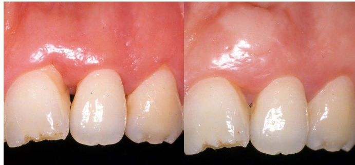
Resim 5. Papil kayıplarının tedavisinde sıklıkla subepitelyal bağ dokusu greftleri kullanılmasına karşın başarı her-zaman elde edilememektedir. Başarıyı olumsuz etkileyen faktörlerin başında ince diş eti biyotipi gelmektedir.

Estetik periodontal zorluklar arasında en önemli yeri tutan ve aynı zamanda da tedavisi en güç olan sorunların başında papil kayıpları gelmektedir. Papil kayıplarının etyolojisinde periodontal hastalıklar başı çekmekte ardından hatalı protetik uygulamalar ve hastanın kürdan kullanmak gibi kötü alışkanlıkları gelmektedir. Papil kayıplarının ortadan kaldırılmasında periodontal veya protetik yöntemlerden biri veya her ikisinin beraber kullanılması tercih edilebilir (Resim 5).