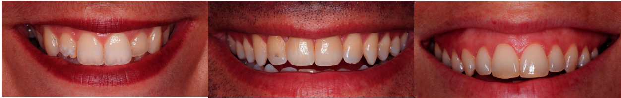
Resim 1. a,b,c: Gülme hattının belirlenmesinde Vermillon hattı ile üst ön bölgede serbest diş eti kenarının ilişkisi dikkate alınmaktadır. Normal gülme hattı yaşın ilerlemesi ile dikey yönde yer değiştirir.

Normal gülme hattı kavramı gülümseme sırasında üst dudağın konumu belirler. Haliyle Diş eti kenarının konumu gülümseme sırasında görülecek Diş eti miktarını etkileyecektir. Gülümseme sırasında orta keser ve köpek dişlerinde diş eti kenarının dudak tarafından örtülmesi ve yan keserlerde 1-2mm Diş eti kenarının açığa çıkması normal olarak kabul edilir (Resim 1a). Gülme hattının zaman içerisinde apikale doğru konum değiştirdiği ve normal olan bir gülme hattının zaman içerisinde düşük gülme hattına (Resim1 b) dönüşeceği unutulmamalıdır. Gülümseme sırasında orta keser ve köpek dişlerinde diş etlerinin ortaya çıkması ise yüksek gülme hattı olarak isimlendirilir (Resim 1c).