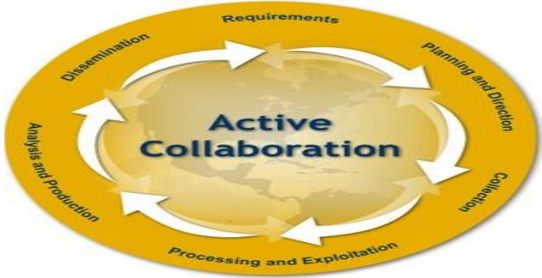
Şekil 2.2: Federal Araştırma Bürosu (FBI) İstihbarat Çarkı

https://www.fbi.gov/about/leadership-and-structure/intelligence-branch