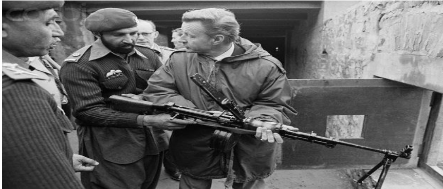
Şekil 4.1. Brzezinski-Bin Ladin

Fakat Brzezinski, 2004 yılında kaleme aldığı The Choice (Tercih) isimli kitabında, radikal İslamcılarının artık Amerika ve İsrail'e düşmanlık beslediklerini ifade etmekte (Brzezinski, 2005:67), Amerika'nın yeni düşmanının radikal İslam olduğunu savunmaktadır.