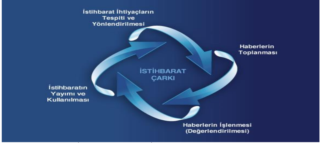
Şekil: 2.1: Milli İstihbarat Teşkilatı İstihbarat Çarkı < http://www.mit.gov.tr/t-cark.html >

ABD’nde dış istihbarata bakmakla görevli ‘Merkezi İstihbarat Teşkilatı’ (CIA) ise bu safhaları 5 bölüme ayırmaktadır. Bunlar: 1-Planlama ve yönlendirme (Planning and Direction), 2- Haberlerin toplanması (Collection), 3- Haberlerin işlenmesi (Processing), 4-Analiz ve üretim (Analysis and Production), 5- Dağıtım (Dissemination) ( https://www.cia.gov/kids-page/6-12th-grade/who-we-are-what-we-do/the-intelligence-cycle.html ).