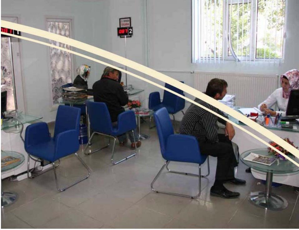
Fot. – 3: Basın Yayın ve Halkla İlişkiler M d rl g  (Arnavutk y Bel. Arşivi)