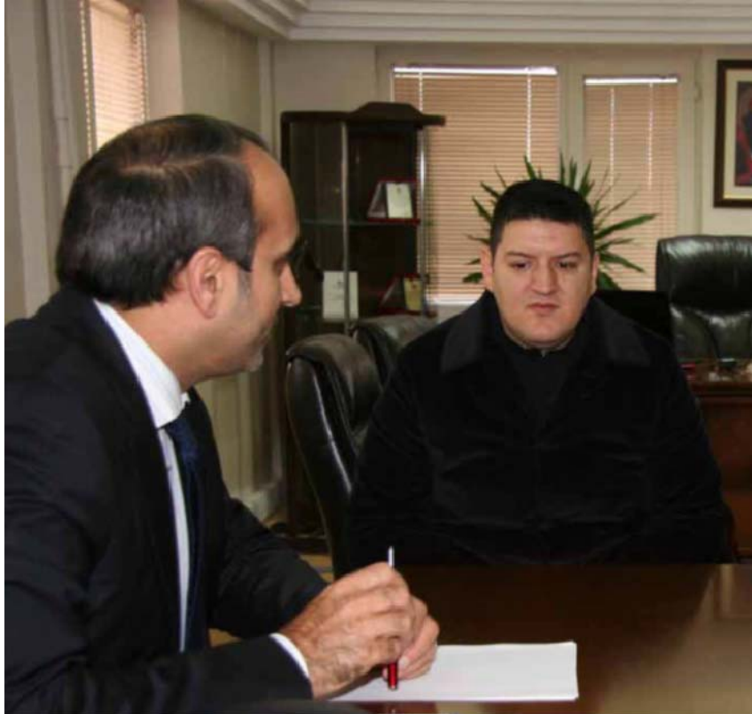
Fot. – 2 : Özel Kalem Müdürlüğü (Arnavutköy Bel. Arşivi)