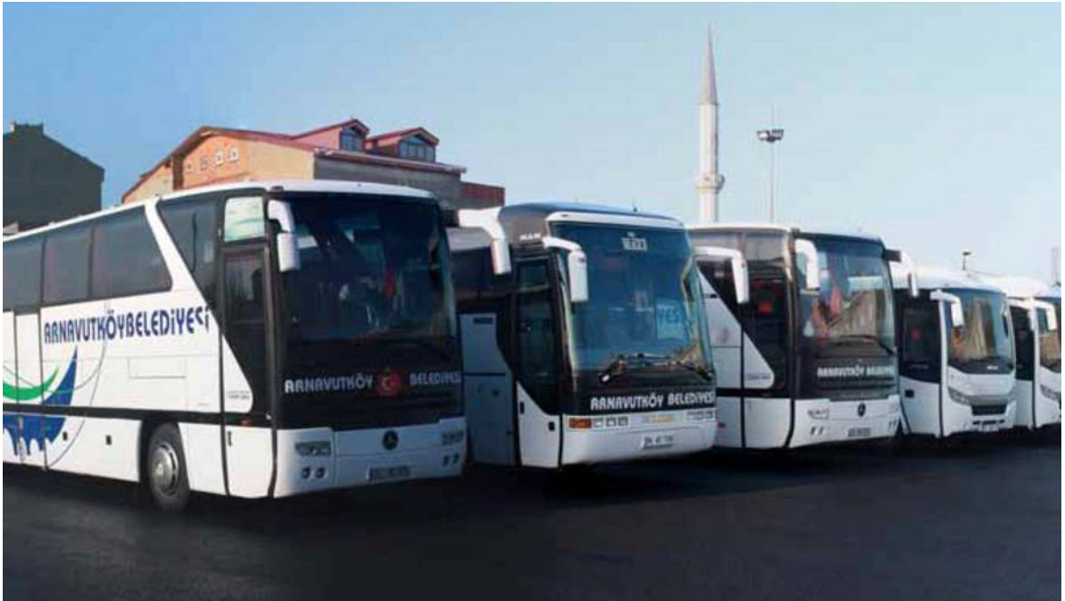
Fot. - 4 : Destek Hizmetleri M d rl g  -1 (Arnavutk y Bel. Arşivi)