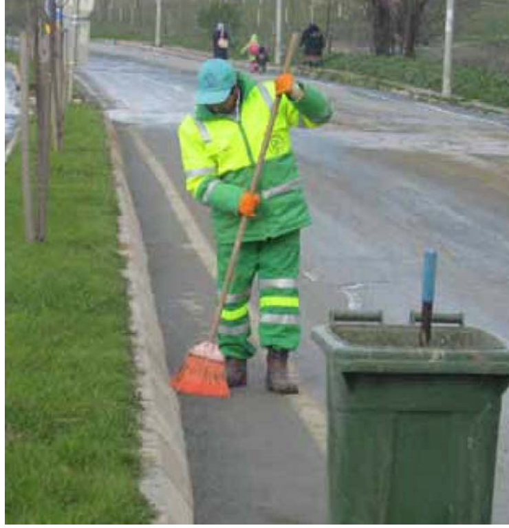
Fot. – 5 : Park ve Bahçeler Müdürlüğü (Arnavutköy Bel. Arşivi)