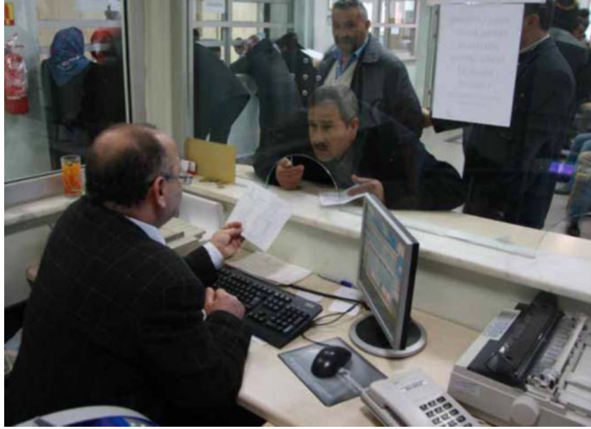
Fot. – 1 :Mali Hizmetler Müdürlüğü(Arnavutköy Bel. Arşivi)